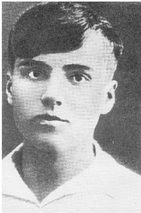
В.А. Сухомлинский в 1934 году

Общие идеи педагогической системы Сухомлинского начали складываться в предвоенный период (1935 – июнь 1941). Сначала Василий Александрович учился в медицинском техникуме, но вскоре ушел оттуда и был зачислен на рабочий факультет, успешно закончил его и поступил в Полтавский педагогический институт, где через два года перевелся на заочное отделение по состоянию здоровья.