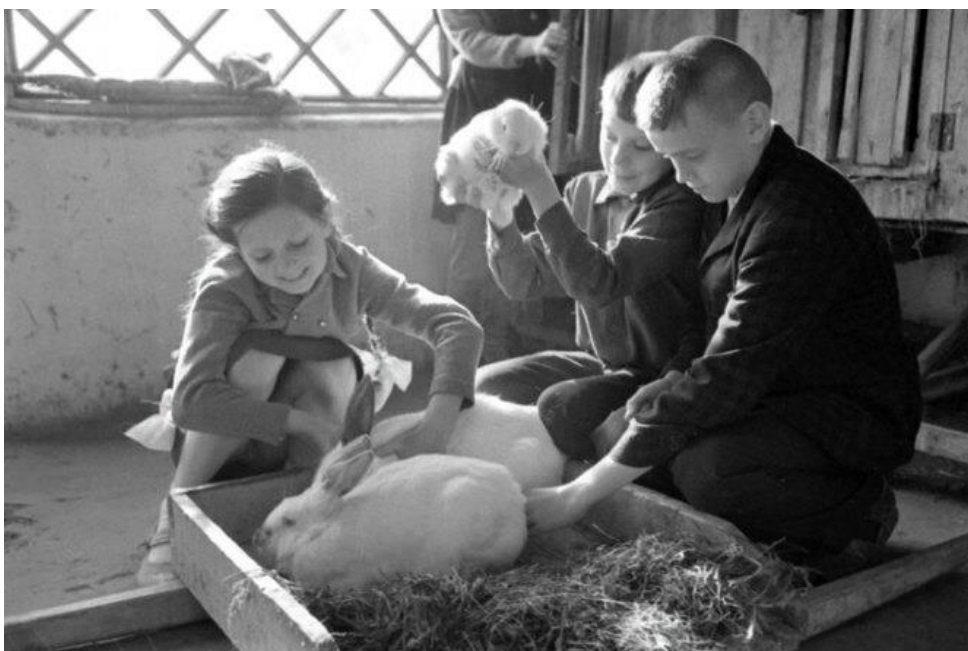
Дети в «живом уголке» Павлышской средней школы

Для Павлышского учителя в воспитании ведущей становится педагогическая установка на синхронный процесс воздействия двух субъектов. В центре учебно-педагогического взаимодействия находится ребенок с его активностью, интересами, индивидуальными творческими способностями, на которые, прежде всего, и должны были ориентироваться учителя. В данной связи главной задачей педагогов становится создание благоприятных условий для развития детей.