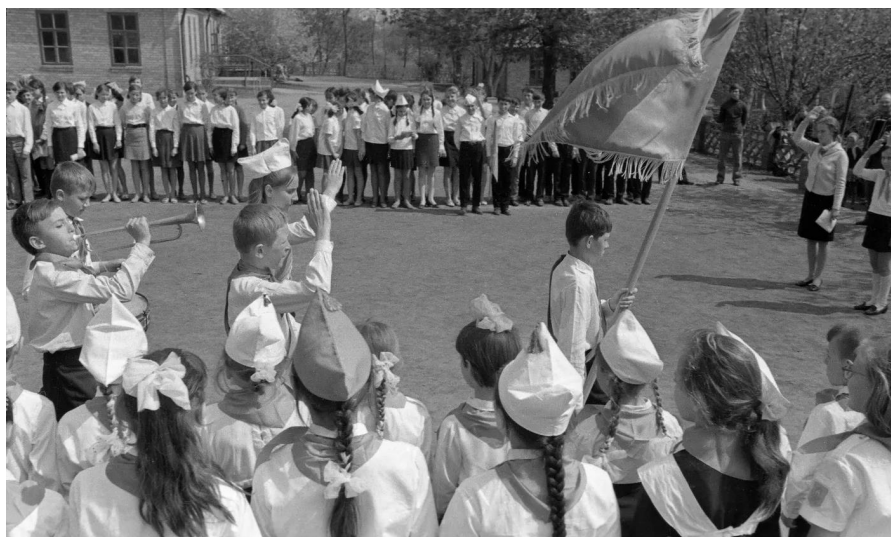
Торжественная линейка, посвященная дню рождения В. И. Ленина, в Павлышской средней школе

С течением времени историческая дистанция между современностью и эпохой В.А. Сухомлинского неуклонно увеличивается. Однако наследие выдающихся деятелей, вопреки временному разрыву, не утрачивает актуальности – напротив, их идеи обретают новую значимость для последующих поколений. Гуманистическая педагогика Василия Александровича Сухомлинского служит наглядным подтверждением этой закономерности: её принципы последовательно реализуются и развиваются в современной образовательной практике, а данный процесс носит необратимый характер.