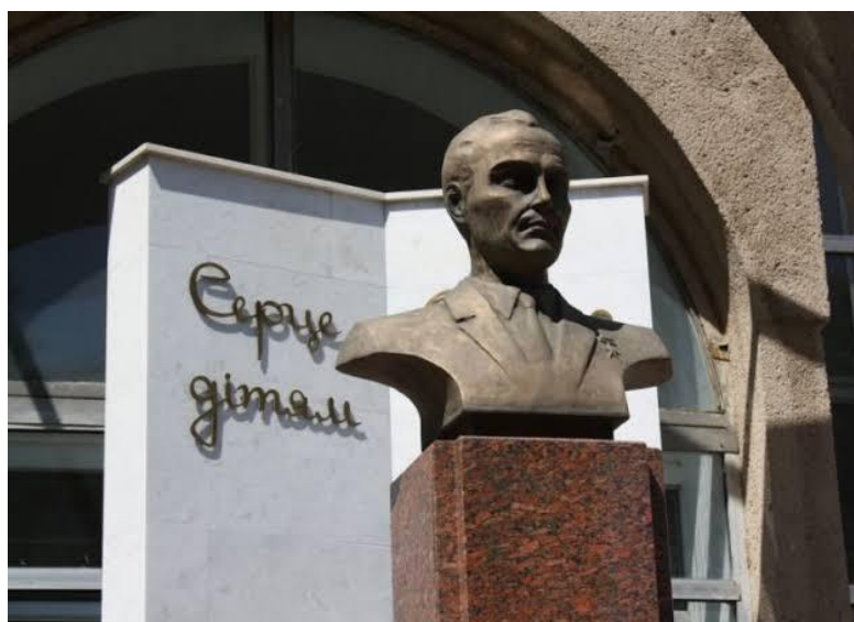
Памятник В.А. Сухомлинскому, г. Николаев

С течением времени историческая дистанция между современностью и эпохой В.А. Сухомлинского неуклонно увеличивается. Однако наследие выдающихся деятелей, вопреки временному разрыву, не утрачивает актуальности – напротив, их идеи обретают новую значимость для последующих поколений. Гуманистическая педагогика Василия Александровича Сухомлинского служит наглядным подтверждением этой закономерности: её принципы последовательно реализуются и развиваются в современной образовательной практике, а данный процесс носит необратимый характер.