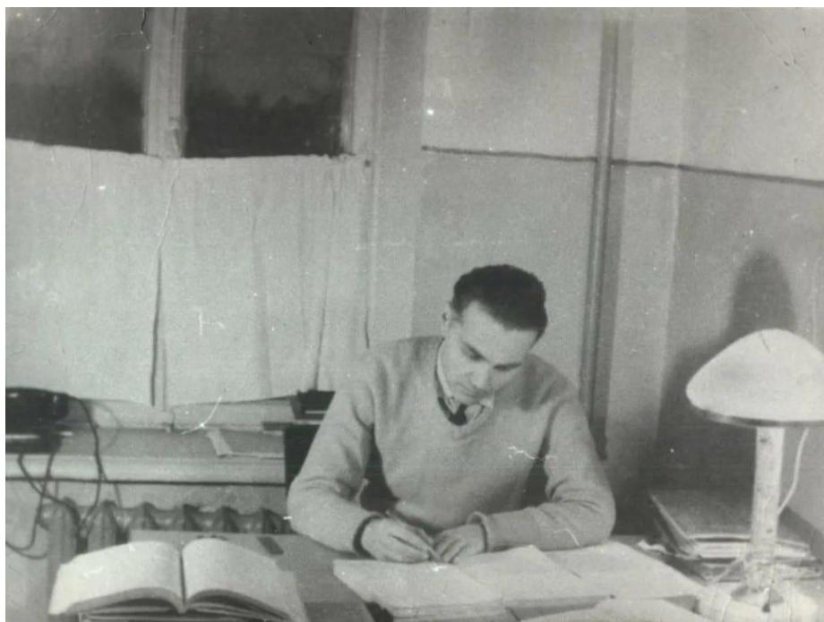
Сухомлинский В.А. за работой

В 8:00 директор школы направлялся в школьный вестибюль, где приветствовал учащихся и педагогов. Далее он посещал 2-3 урока коллег-единомышленников. Наряду с этим Сухомлинскому приходилось решать многочисленные хозяйственные вопросы. Однако даже в процессе выполнения административных и организационных задач он сохранял фокус на педагогическом поиске – стремился к новым наблюдениям и профессиональным открытиям. Современники неизменно отмечали характерную деталь облика Василия Александровича: он практически всегда был с книгой в руках.