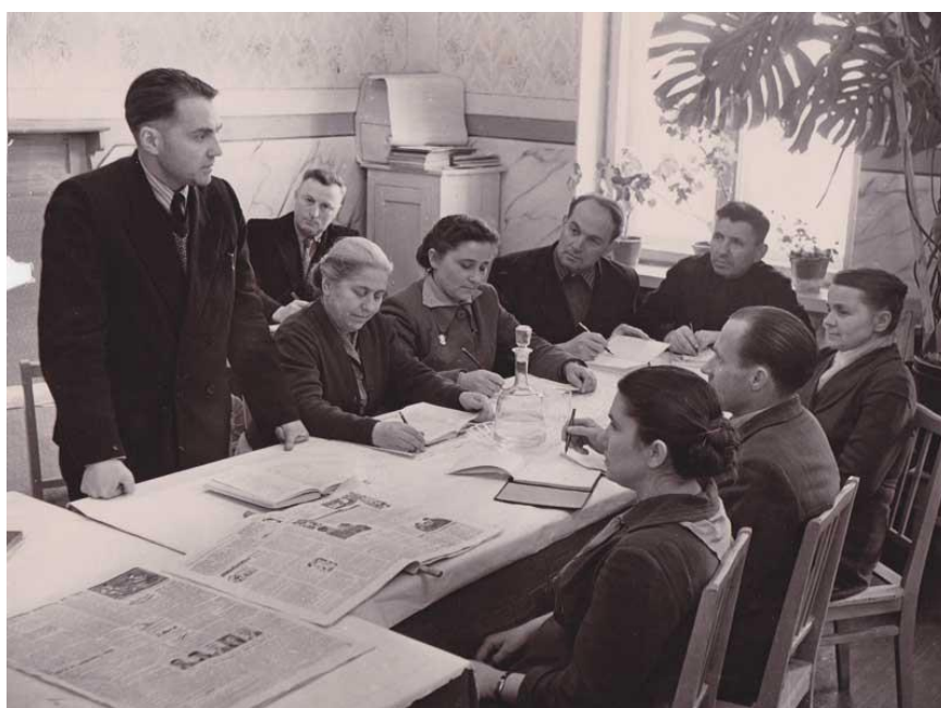
Сухомлинский В.А. с педагогами Павлышской средней школы

Постепенно вокруг В.А. Сухомлинского сформировался коллектив молодых педагогов-единомышленников, совместными усилиями которых были реализованы существенные инфраструктурные преобразования: построены новые школьные помещения и мастерские, заложены теплицы. Год за годом преображался и школьный участок, превращаясь в цветущий сад, как и мечтал Василий Александрович.