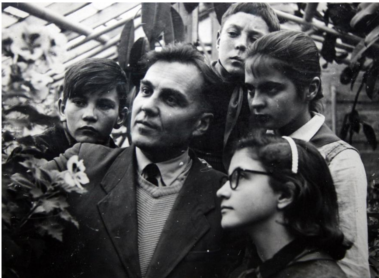
Урок с учениками в теплице