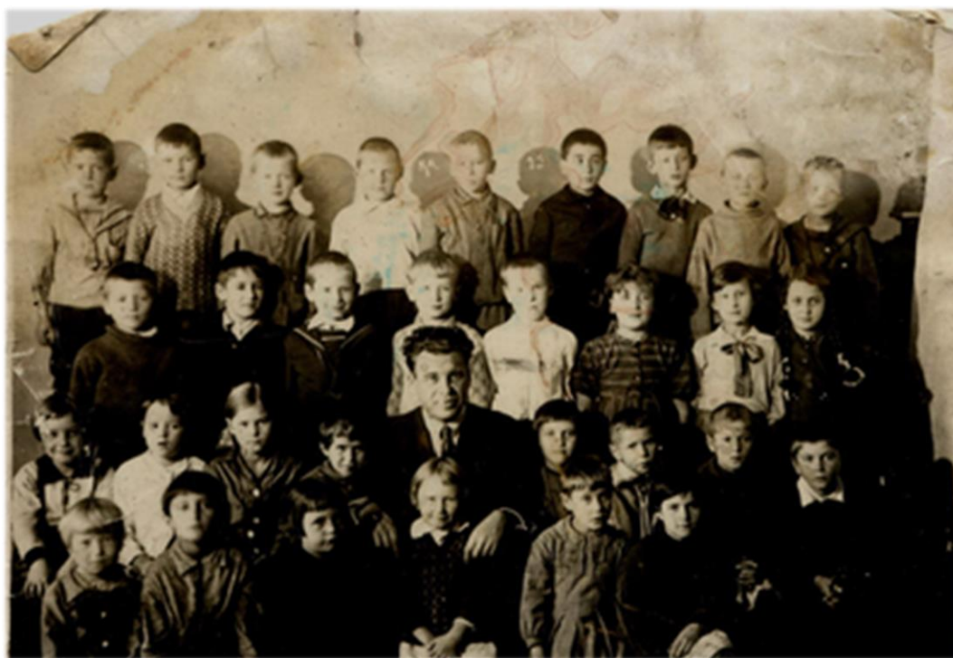
Д.Б. Эльконин и его ученики 1-го класса

Лишь с большим трудом Даниилу Борисовичу удалось получить место учителя начальных классов в школе, где обучались его дочери. Принять Эльконина на работу решился директор учебного заведения, который был с ним хорошо знаком и пошёл на определённый профессиональный риск.