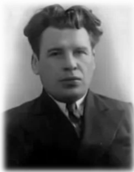
Д.Б. Эльконин в 1930-х

Существенное влияние на становление Эльконина как учёного оказали выдающиеся исследователи – физиолог А.А. Ухтомский и психолог Л.С. Выготский. В 1931 году совместно с Л.С. Выготским Даниил Борисович приступил к изучению проблем психологии детской игры.