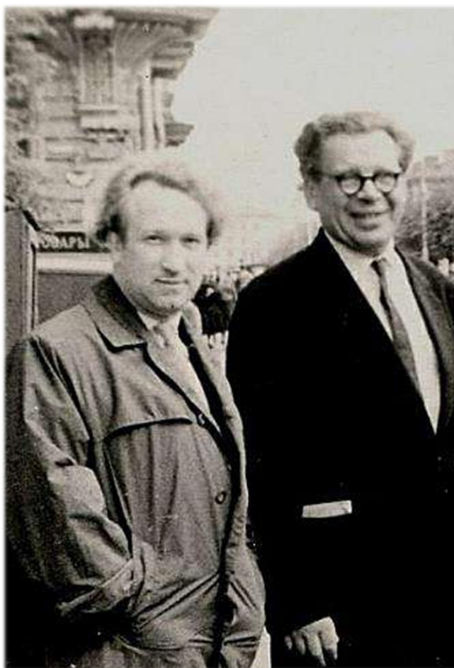
Д.Б. Эльконин и В.В. Давыдов в начале совместной работы (1960-е гг.)

Совместно со своим учеником и сподвижником В.В. Давыдовым Эльконин сформулировал концепцию учебной деятельности, центральным элементом которой является учебная задача – цель, побуждающая ученика осваивать общие способы действия, а не просто запоминать факты. Ключевые характеристики учебной деятельности по Эльконину: