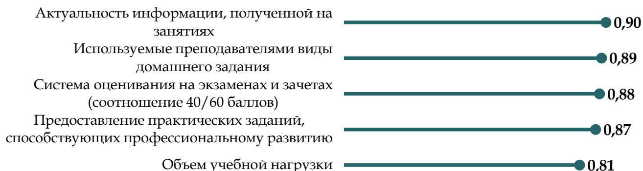
Рисунок 1 – Удовлетворенность основными аспектами учебного процесса

Общий индекс удовлетворенности основными аспектами учебного процесса находится на высоком уровне ( i=0,87 ) (рисунок 1). В сравнении с другими аспектами, студенты менее удовлетворены объемом учебной нагрузки ( i=0,81 ).