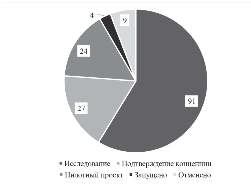
Рис. 1. Мировой опыт распространения цифрового рубля (апрель 2025 г.), количество стран

Источник: составлено автором по данным CBDC Tracker [8].