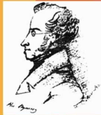
Портрет Грибоедова, сделанный А.С. Пушкиным

Грибоедов пробовал свои силы и как критик, и как поэт, но вошёл в историю русской литературы как автор бессмертного шедевра – комедии «Горе от ума», известного каждому русскому человеку. Работа над комедией была закончена А.С. Грибоедовым в 1824 г. и, в соответствии с пророчеством А.С. Пушкина, сразу же разошлась на цитаты и крылатые выражения. «Горе от ума» в равной мере принадлежит литературе и театру, не сходя со сценических подмостков России уже почти 200 лет.