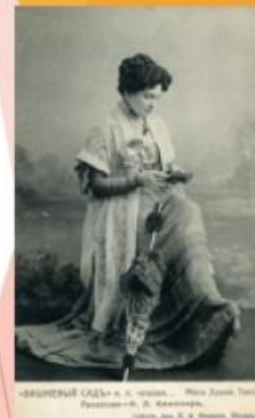
Впервые пьеса Чехова

«Вишневый сад» – последнее произведение, написанное автором. Чехов наполнил пьесу размышлениями о доме, о жизни, о родине, о любви, об утрате, о скоротечности времени. Читая пьесу, видишь, что с персонажами как бы вообще ничего не происходит. Нет ни конфликтов, ни стрельбы, ни любовных драм. Бытовые мелочи, диалоги, монологи, реплики – вот и все. Но из этого вырастают характеры и судьбы героев. И, что удивительно, при чтении пьесы испытываешь массу чувств. Это и неприязнь, и недоумение, и жалость, и надежда, и грусть, и тоска. Пьеса «Вишневый сад» до сих пор остается одной из наиболее востребованных на театральной сцене.