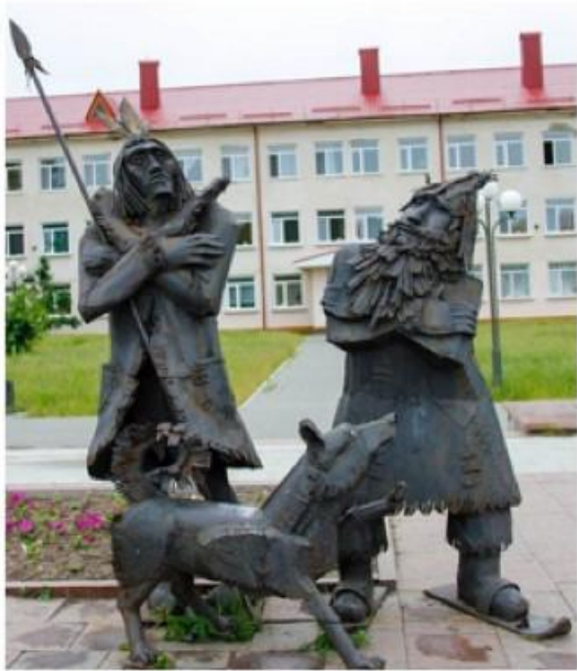
В г. Тобольск установили скульптурную композицию «Робинзон Крузо и Пятница». Дело в том, что по сюжету книги в Тобольске Р. Крузо проводит 8 месяцев.

Биографию английского писателя можно было бы назвать «Взлеты и падения Даниеля Дефо». Даниель Фо (настоящая фамилия) занимался коммерцией, политикой, журналистикой, был тайным агентом, ему неоднократно приходилось сидеть в тюрьме и скрываться от правосудия. Аристократическую приставку «де», впоследствии ставшую частью его фамилии, он присвоил себе самолично, при этом обзаведясь еще «фамильным гербом» и девизом «Похвалы достоин и горд».