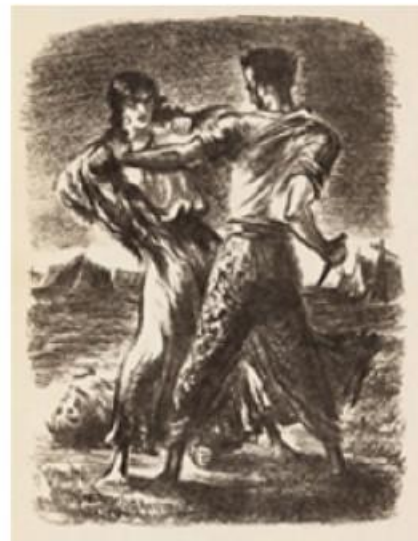
Рисунки К. Клементьевой к поэме «Цыганы»