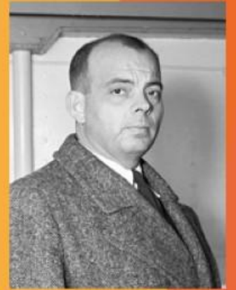
Антуан де Сент-Экзюпери

Антуан Мари Жан-Батист Роже де Сент-Экзюпери – так полностью звучит имя французского писателя. В семнадцать лет он сделал свой главный жизненный выбор – решил стать летчиком. Эта профессия и сейчас считается рискованной, а в начале двадцатого века, когда самолеты были еще технически несовершенны, быть летчиком означало подвергать себя смертельной опасности постоянно. Сам писатель неоднократно попадал в авиакатастрофы, получил множество тяжелых травм, пережил потерю друзей-летчиков. Эти особые жизненные условия сделали Сент-Экзюпери великим гуманистом, он понял, что на самом деле является истинной ценностью в жизни человека, и всем своим творчеством пытался донести это до своих читателей.