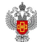
Федеральная служба по надзору в сфере здравоохранения