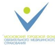
Московский городской фонд обязательного медицинского страхования