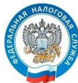
Управление Федеральной налоговой службы по Московской области