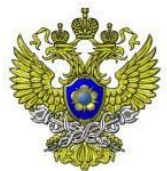
Федеральная служба по финансовому мониторингу