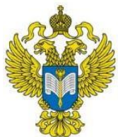
Управление Федеральной службы государственной статистики по г. Москве и Московской области