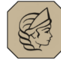
Федеральная пробирная палата