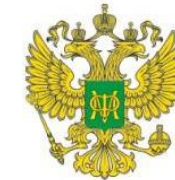
Министерство финансов Российской Федерации