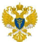
Счетная палата Российской Федерации