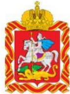
Министерство социального развития Московской области