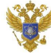
Министерство науки и высшего образования Российской Федерации