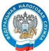
Межрегиональная инспекция Федеральной налоговой службы по крупнейшим налогоплательщикам № 4