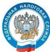
Межрегиональная инспекция Федеральной налоговой службы по крупнейшим налогоплательщикам № 3