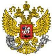
Министерство экономического развития Российской Федерации