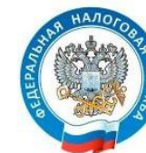
Межрегиональная инспекция Федеральной налоговой службы по крупнейшим налогоплательщикам № 6