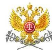
Суд по интеллектуальным правам