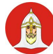
Управа Головинского района г. Москвы