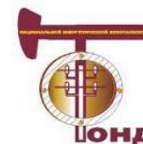
Фонд национальной энергетической безопасности