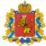
Администрация Владимирской области