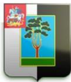
Контрольно-счетная палата муниципального образования «Городской округ Черноголовка»