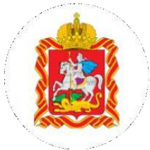
Администрация Губернатора Московской области