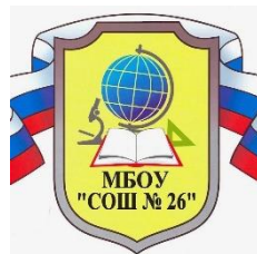
Муниципальное бюджетное общеобразовательное учреждение Средняя общеобразовательная школа № 26 г. Химки