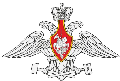
Правовой департамент Министерства обороны Российской Федерации