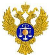
Управление Федерального казначейства по Московской области