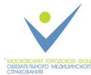
Московский городской фонд обязательного медицинского страхования