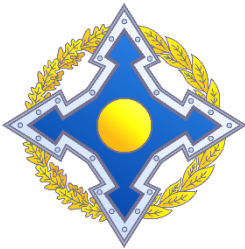
Секретариат Организации Договора о коллективной безопасности