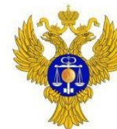
Управление Федерального казначейства по Калининградской области