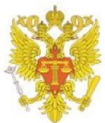
Управление Судебного департамента в г. Москве