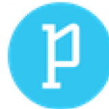
Администрация муниципального округа Пресненский