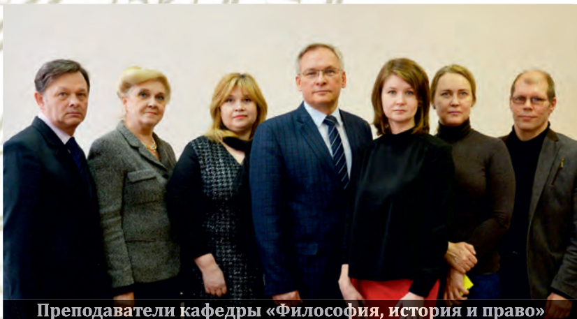
Преподаватели кафедры «Философия, история и право»