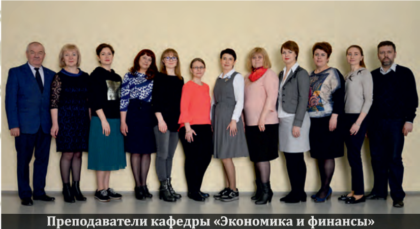
Преподаватели кафедры «Экономика и финансы»