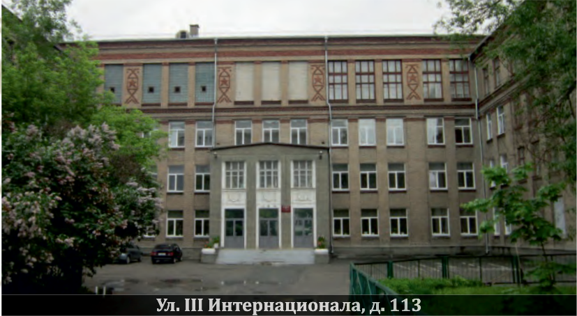
Ул. III Интернационала, д. 113

и «Статистика»); Финансово-кредитном (специальность «Финансы и кредит»); Экономике промышленности (специальности «Экономика промышленности» и «Экономика труда»); Общеэкономическом (специальности «Планирование народного хозяйства», «Материально-техническое снабжение» и «Экономика сельского хозяйства»). В дальнейшем специальность «Экономика сельского хозяйства» Челябинскому У КП не планировалась, так как не обеспечивался набор. Специальность «Экономика промышленности» позднее стала называться «Планирование промышленности».