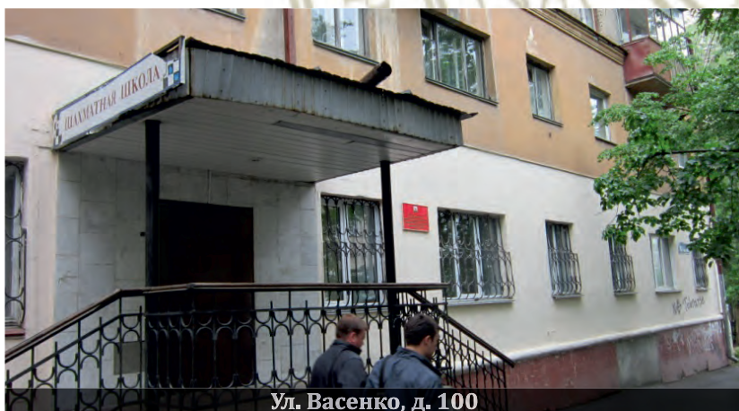
Ул. Васенко, д. 100

Имеющаяся учебная площадь не могла обеспечить потребности стремительно расширяющегося контингента студентов, и филиалу приходилось дополнительно арендовать помещения в находящихся недалеко учебных корпусах института механизации и электрификации сельского хозяйства (ЧИМЭСХ), а в начале 1970-х годов – института физкультуры. Филиал, его директор и весь коллектив, при поддержке руководства ВЗФЭИ