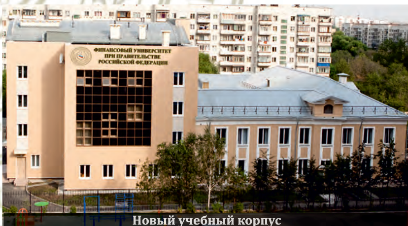
Новый учебный корпус

В мае 2012 года решением Правительства Российской Федерации ВЗФЭИ был присоединен к ФГОБУ ВПО «Финансовый университет при Правительстве Российской Федерации» и таким образом филиал стал структурным подразделением этого мощного, имеющего большой международный авторитет финансово-экономического вуза. Новый статус предусматривает