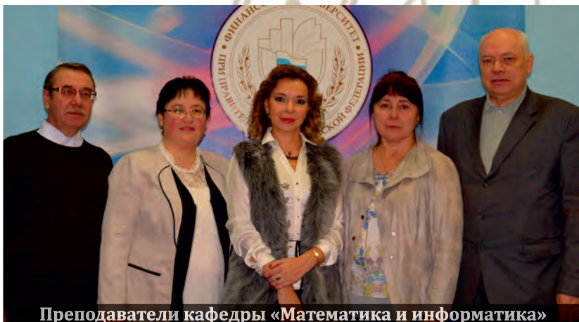
Преподаватели кафедры «Математика и информатика»

Кадровая политика кафедры направлена на сохранение основного кадрового состава, повышение квалификации каждого преподавателя с учетом его индивидуальных особенностей и поставленных задач, а также сотрудничество с преподавателями вузов-партнеров: Южно-Уральского государственного университета, Челябинского государственного университета и др.