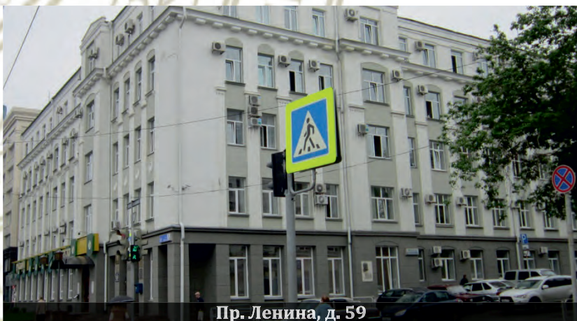
Пр. Ленина, д. 59

В 1960 году, после неоднократных просьб и ходатайств руководства ВЗФЭИ и Челябинского У КП, ему была предоставлена расширенная служебная площадь в 112 квадратных метров (четыре комнаты) на проспекте Ленина, 59. Здесь в одной комнате разместились заведующий У КП, секретарь-машинистка, методист и библиотека. Остальные комнаты использовались для занятий как классы. Кроме занятий в вечернее время, которые проводились в арендуемых помещениях школы № 63, появилась возможность проводить консультации и другую работу со студентами в дневное время.