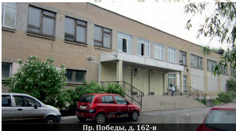
Пр. Победы, д. 162-в

В 1977 году факультету было предоставлено здание бывшей совпартшколы по улице Работниц, 58, кото-