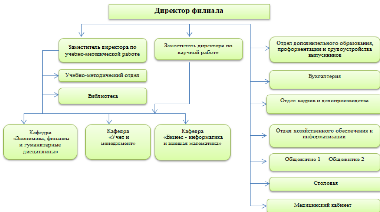
Схема 1. Организационная структура управления Калужского филиала ФГОБУ ВО «Финансовый университет при Правительстве Российской Федерации»

Организационная структура управления Калужского филиала Финуниверситета представлена на схеме 1.