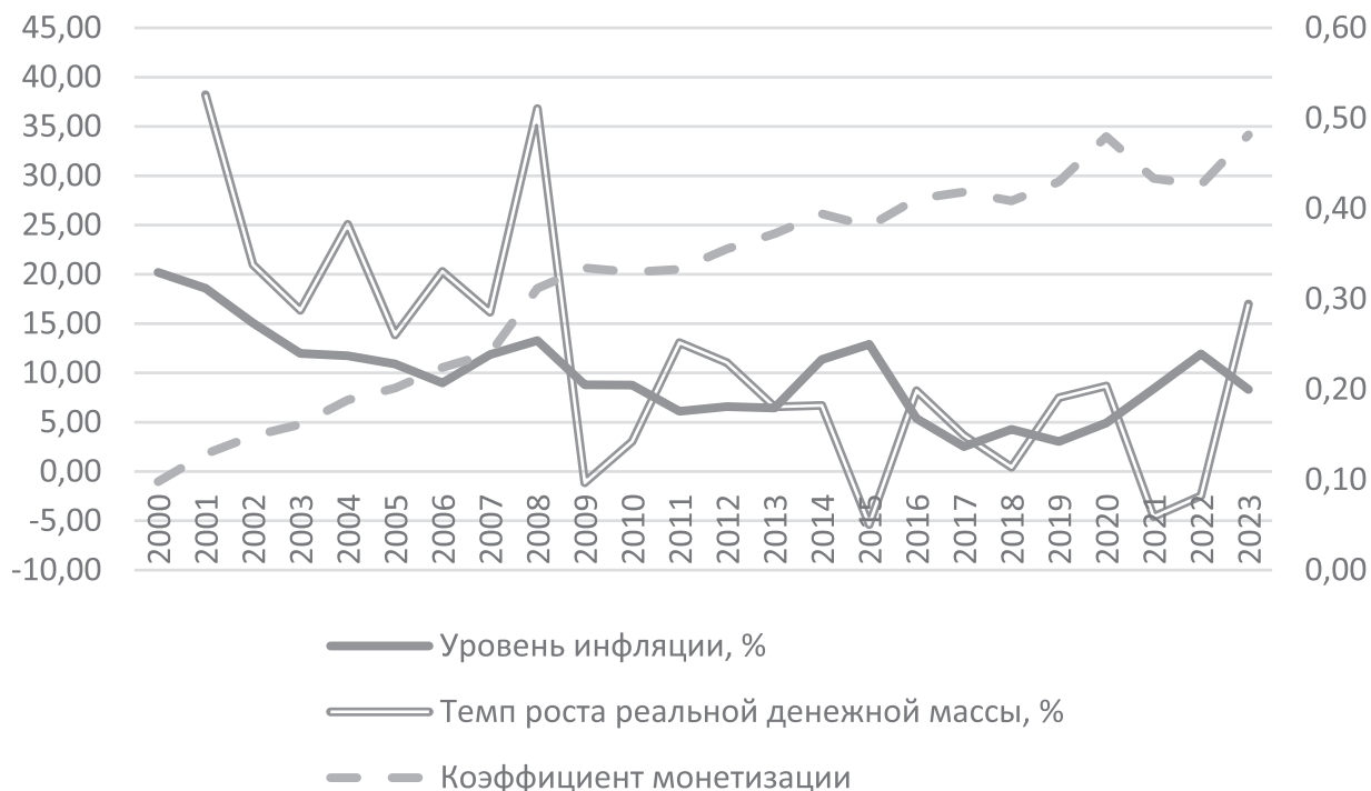
Рис. 2. Динамика уровня инфляции, %, темпа роста денежной массы, % и коэффициента монетизации, Российская Федерация, 2000–2023 гг.