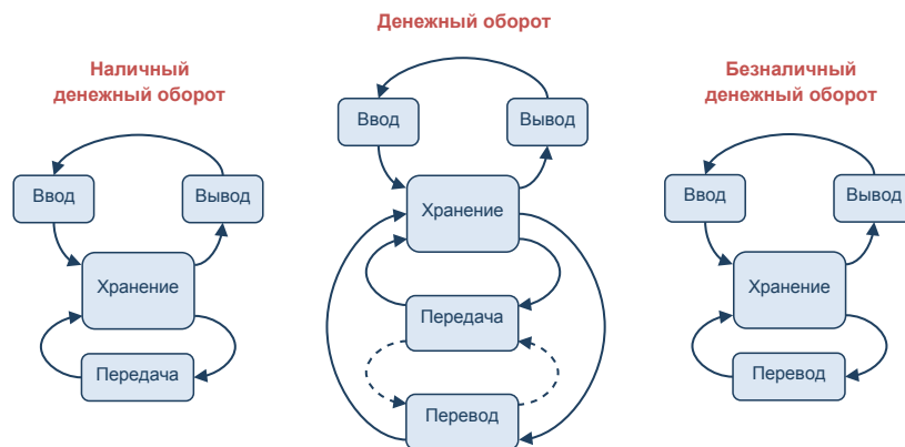
Рис. 1. Механизмы стадий денежного оборота

Исходя из представлений о жизненном цикле отдельного объекта категории денег, движение денег в рамках системы денежного оборота можно представить как движение совокупности взаимосвязанных объектов категории денег, каждый из которых имеет свой собственный жизненный цикл. Это позволяет выделить стадии денежного оборота (по аналогии со стадиями жизненного цикла – ввод в оборот, вывод из оборота, хранение и изменение объектов), установив, что все объекты категории денег (выбранной системы денежного оборота), находящиеся в один и тот же момент времени на одной и той же стадии жизненного цикла, относятся к соответствующей стадии денежного оборота. При этом, исходя из сути изменений,