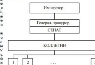
Рис. 1. Органы власти и управления Российской империи в середине XVIII в.

Преобразования системы государственного управления, начатые в 1708 г., продолжались до 1720 г., в результате приказное управление было заменено на коллегияльное. Структура органов государственной власти и управления России, просуществовавшая до 70-х гг. XVIII в., представлена на рис. 1.