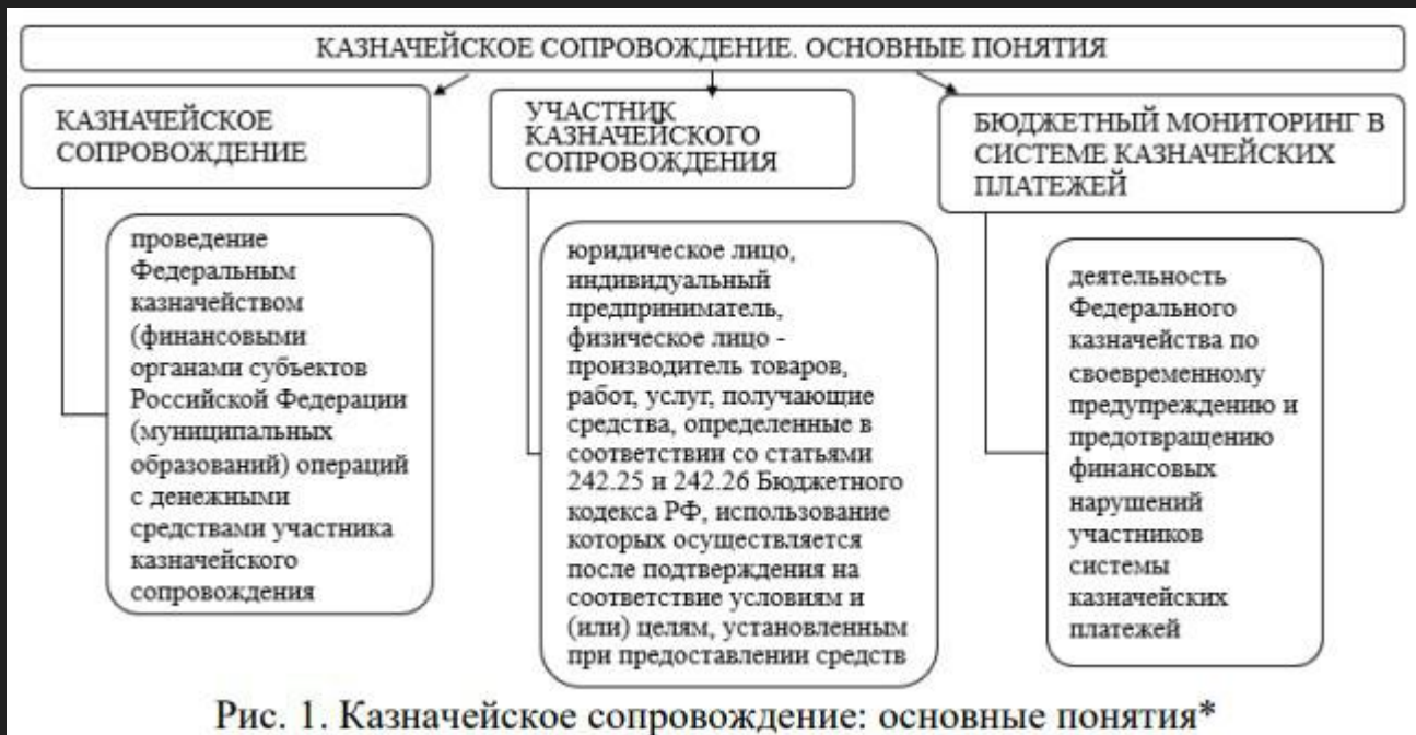
Рис. 1. Казначейское сопровождение: основные понятия*