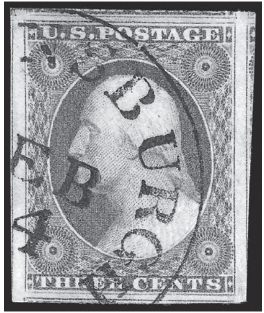
Рис. 7. Почтовая марка за три цента 1851–1857 гг. с изображением Дж. Вашингтона

из-за фидуциарных свойств данного номинала, то есть необеспеченности ее драгоценными металлами. Она была введена в обращение 3 марта 1851 г. указом, который также изменил ее свойства – снизил в ней процент серебра и ее толщину. Интересно, что введение столь малого номинала в Штатах было отчасти мотивировано желанием иметь монету, удобную для приобретения почтовых марок, образец которой отражен на рис. 7 18 . Именно с этого момента в Соединенных Штатах была введена фидуциарная чеканка серебряных монет. Эти трехцентовые монеты были отчеканены в больших количествах с 1851 по 1853 г.