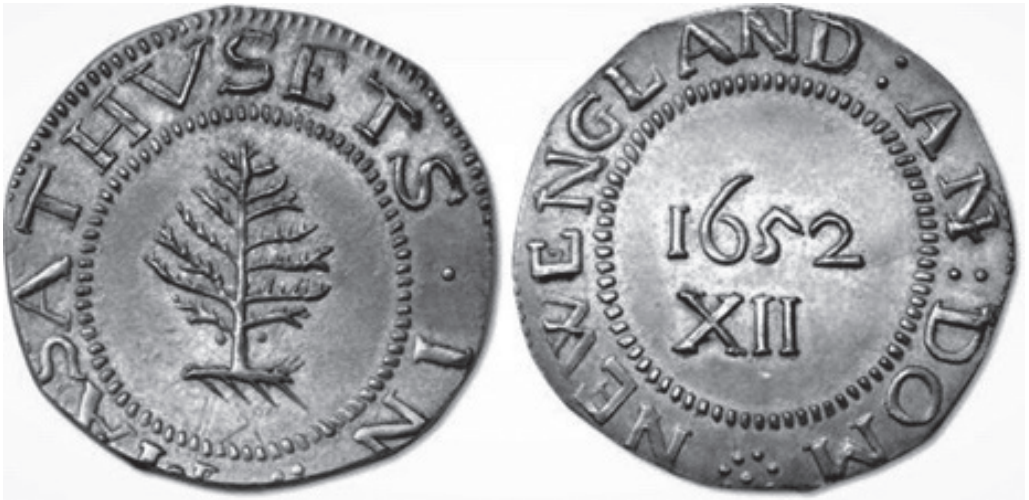
Рис. 2. Первые серебряные монеты Северной Америки, свидетельствующие о биметаллизме

Золотые монеты были привезены в колонии из Великобритании и ряда европейских стран, получавших выгоду от обладания колониями. Поскольку эти золотые монеты были самых разных номиналов и часто имели значительно меньший вес из-за того, что были обрезаны или подделаны, они учитывались по весу, а не по количеству. К примеру, монеты на рис. 2 4 были объектами подделок.