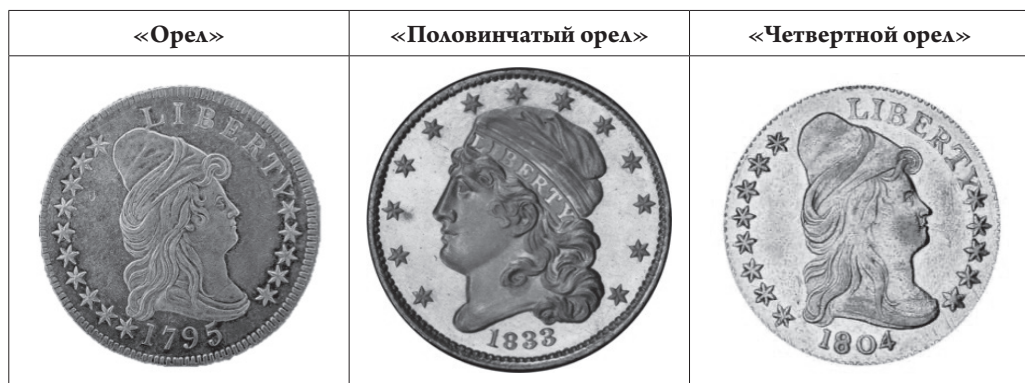
Рис. 6. Разновидность основных золотых монет США с 1795 по 1833 г.

Однако не стоит забывать про закон Грэшема, свидетельствующий о вытеснении «качественных» металлов в обращении «некачественными». Так и в этом случае серебряные монеты были замещены аналогами с гораздо меньшим содержанием серебра, что привело Сенат к мысли о переходе на монометаллизм. Приверженцы же золотого стандарта все еще утверждали, что золото стабильнее серебра, выпуск которого можно было бы законодательно ограничить. Тем не менее в Штатах продолжили свое обращение два металла.