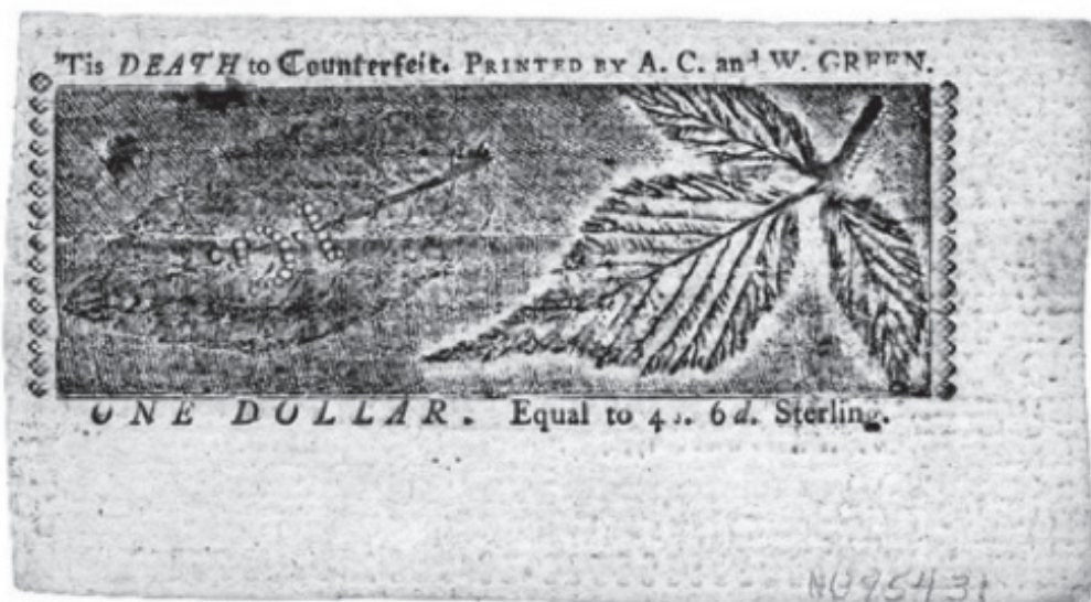
Рис. 3. Образец доллара 1770 г.