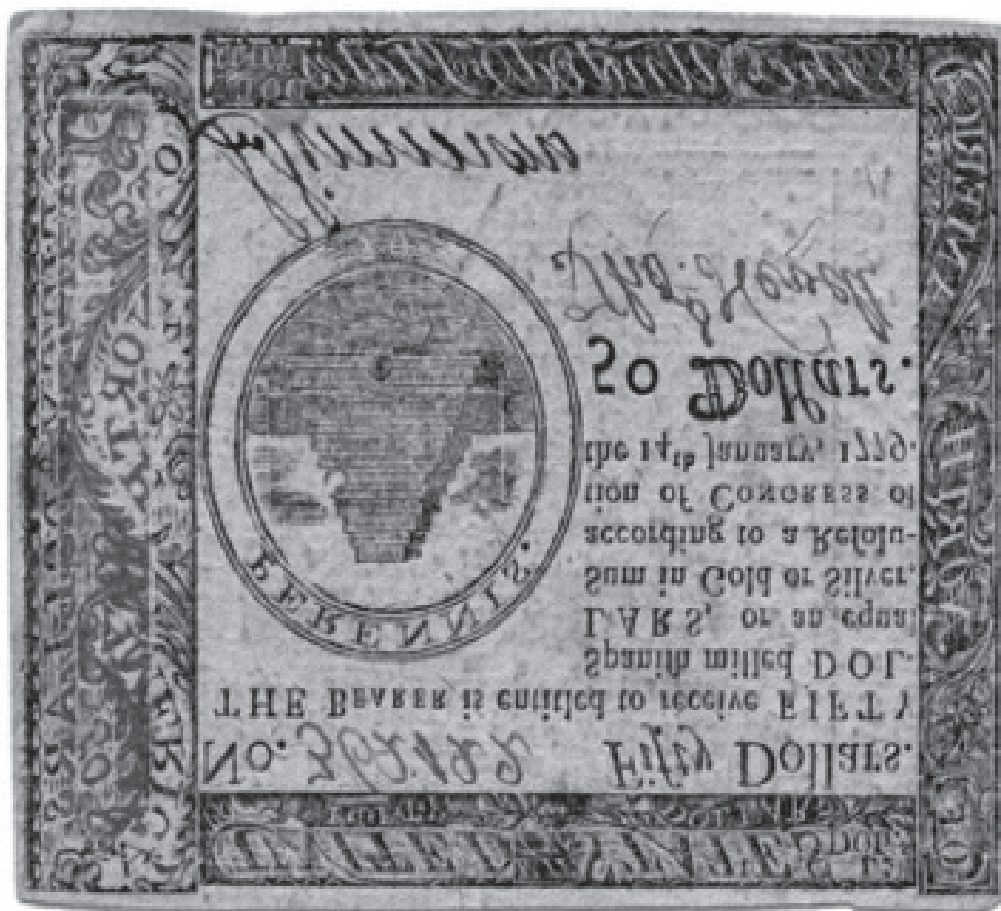
Рис. 4. Образец доллара времен Конфедерации (1779 г.)