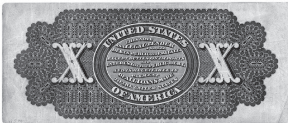
Рис. 8. Greenback номиналом в 10 долл.

излишек дохода в Казначействе и выдавать банкноты не меньшим номиналом, чем в монетах;