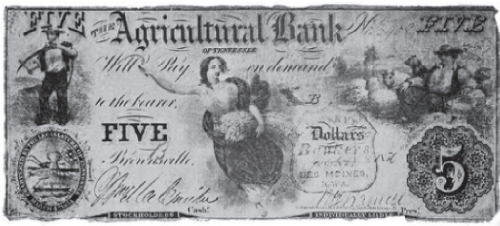
Рис. 5. Образец пятидолларовой банкноты периода биметаллизма

Переходя от зарождения золотого стандарта к его развитию в период системы биметаллизма (с 1792 по 1861 г.), стоит отметить, что начало этому периоду положило принятие в 1792 г. Акта о чеканке монет, который, по сути, узаконил данную систему 12 . Этот документ отразил в полной мере все рассмотренные выше предложения А. Гамильтона за несколькими исключениями: толщина серебряных монет была уменьшена, номинал также был пересмотрен – в обращении появились золотые монеты номиналом 5 и 2,5 доллара, а также серебряные номиналом 50, 25 и 5 центов. Подделка монет и банкнот, к примеру долларов, представленных на рис. 5 13 , должностными лицами, уполномоченными на то Актом, каралась смертью.