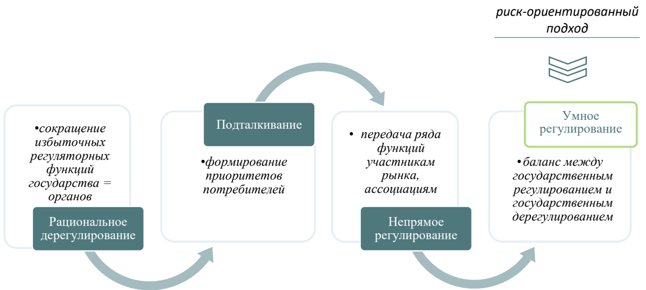
Рисунок 2 - Эволюция экономической роли государства

В современных условиях основополагающей является концепция необходимости «рационального дерегулирования», которая отличается от «дерегулирования», предусматривающего только сокращение численности государственных регулирующих органов, что негативно сказывается как на уровне экономического развития стран, так и снижает доверие частных инвесторов к социально-экономическим проектам, рисунок 2.