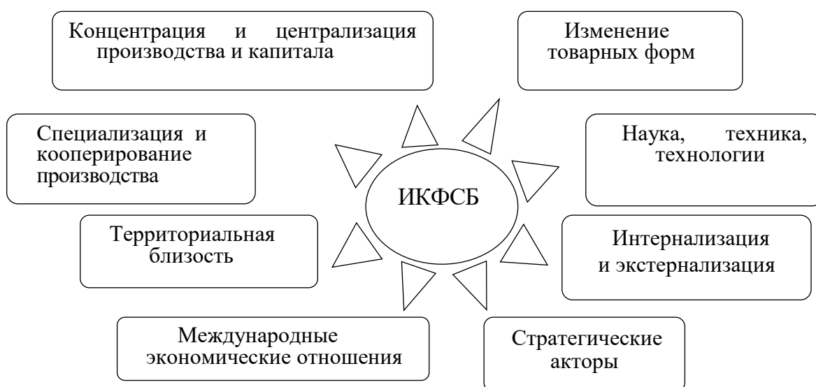
Рисунок 3 – Факторы, влияющие на институциональный каркас формирования стоимости бизнеса

4) Выявлены и проанализированы изображенные на рисунке 3 факторы, влияющие на трансформацию институционального каркаса процесса формирования стоимости бизнеса.