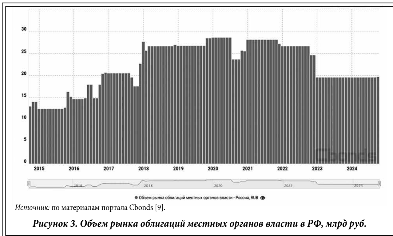
Рисунок 3. Объем рынка облигаций местных органов власти в РФ, млрд руб.

вы межмуниципального сотрудничества, кооперации тоже пока не получили должного развития в России [16, 17].