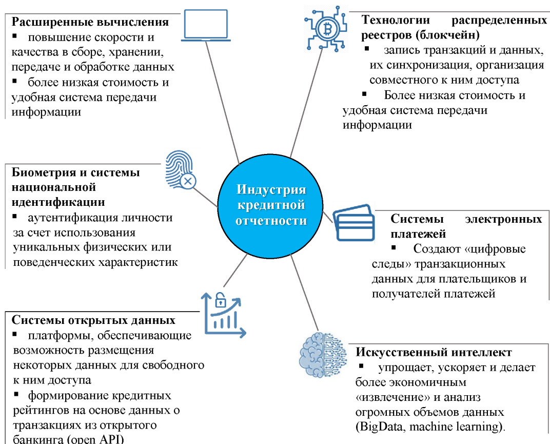
Рис. 2 / Fig. 2. Новые технологии в индустрии кредитной отчетности / New Technologies Used in the Credit Reporting Industry

Источник / Source: составлено по материалам Всемирного банка / Compiled by author based on World Bank materials. URL: https://documents1.worldbank.org/curated/en/587611557814694439/pdf/Disruptive-Technologies-in-the-Credit-Information-Sharing-Industry-Developments-and-Implications.pdf (дата обращения: 08.05.2022) / (accessed on 08.05.2022).