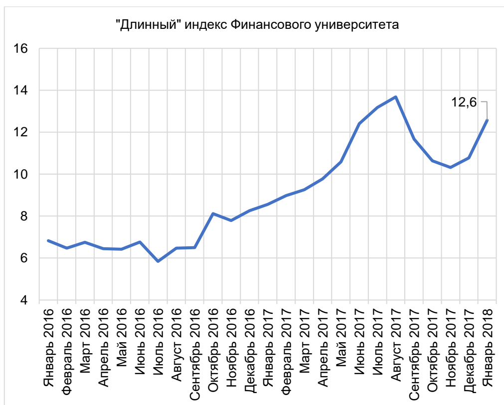
Рисунок 2. «Длинный» индекс Финансового университета при Правительстве РФ в 2016-2018 годах