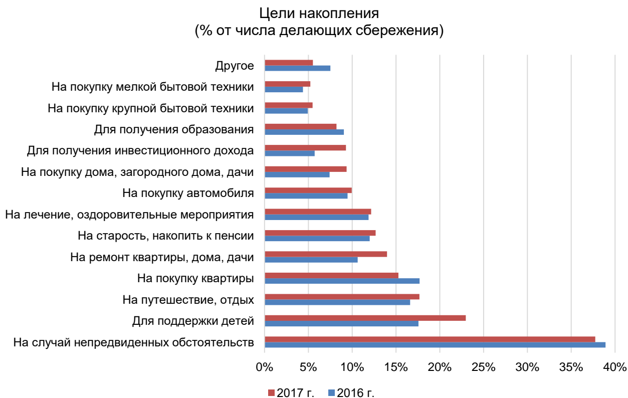
Рисунок 2. Цели накопления в российских семьях в 2016-2017 гг.