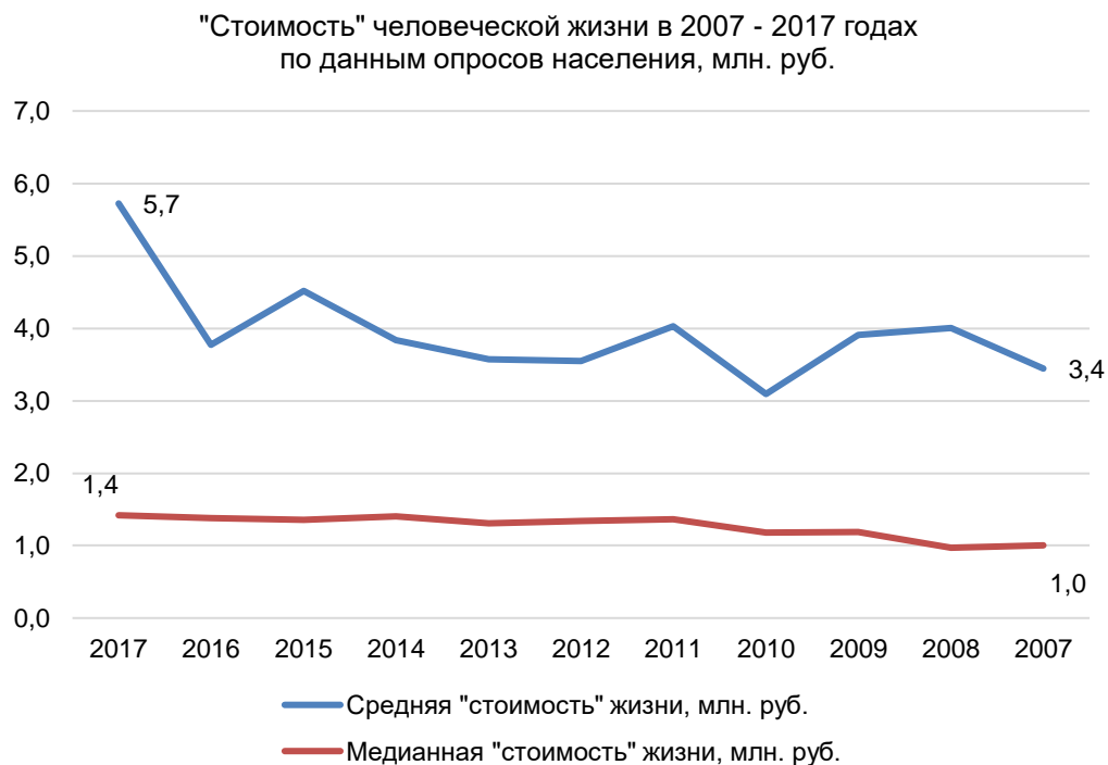
Рисунок 1. Размер «справедливого», «достойного» возмещения в связи с гибелью людей на транспорте, на производстве, в связи с выполнением служебных обязанностей, рассчитанный по данным социологических опросов населения