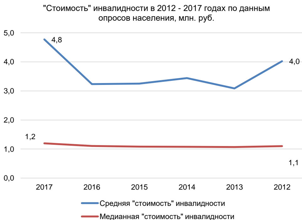
Рисунок 2. Размер «справедливого», «достойного» возмещения в связи с потерей трудоспособности в связи с несчастным случаем на транспорте, на производстве или при выполнении служебных обязанностей, рассчитанный по данным социологических опросов населения