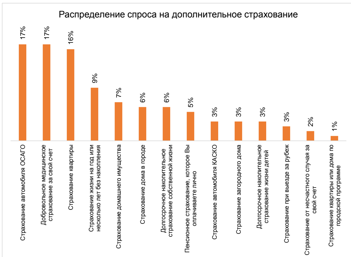
Рисунок 2. Спрос на дополнительное страхование среди граждан

Исследования, проведенные в 2018 году, показали, что спрос на дополнительное страхование (кроме продления тех полисов, которые уже есть на руках у населения) достаточно невелик. Сегодня 93% домохозяйств не собираются приобретать дополнительное страхование сверх имеющихся полисов. Спрос на дополнительное страхование прежде всего сосредоточен в сегменте ОСАГО, медицинского страхования, а также в сегменте страхования квартир. Кроме этого, определенные перспективы роста числа продаваемых полисов есть в сегменте рискованного и накопительного страхования жизни, пенсионного страхования, а также в сегменте страхования городских домов (см. Рисунок 2).