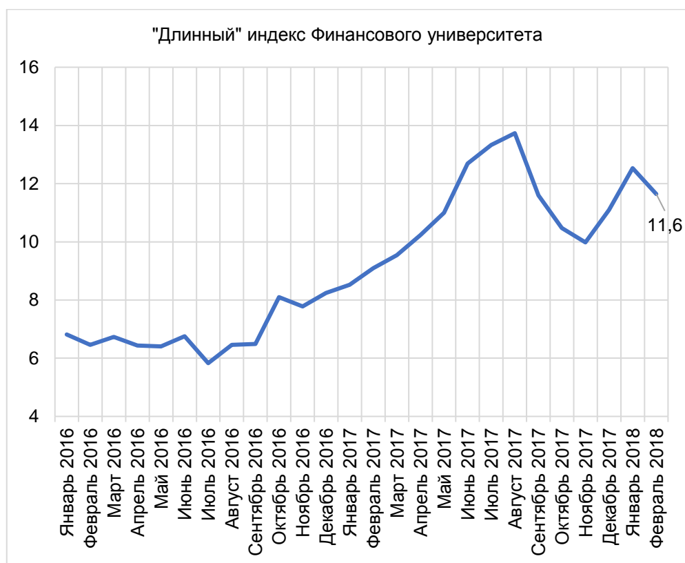
Рисунок 2. «Длинный» индекс Финансового университета при Правительстве РФ в 2016-2018 годах