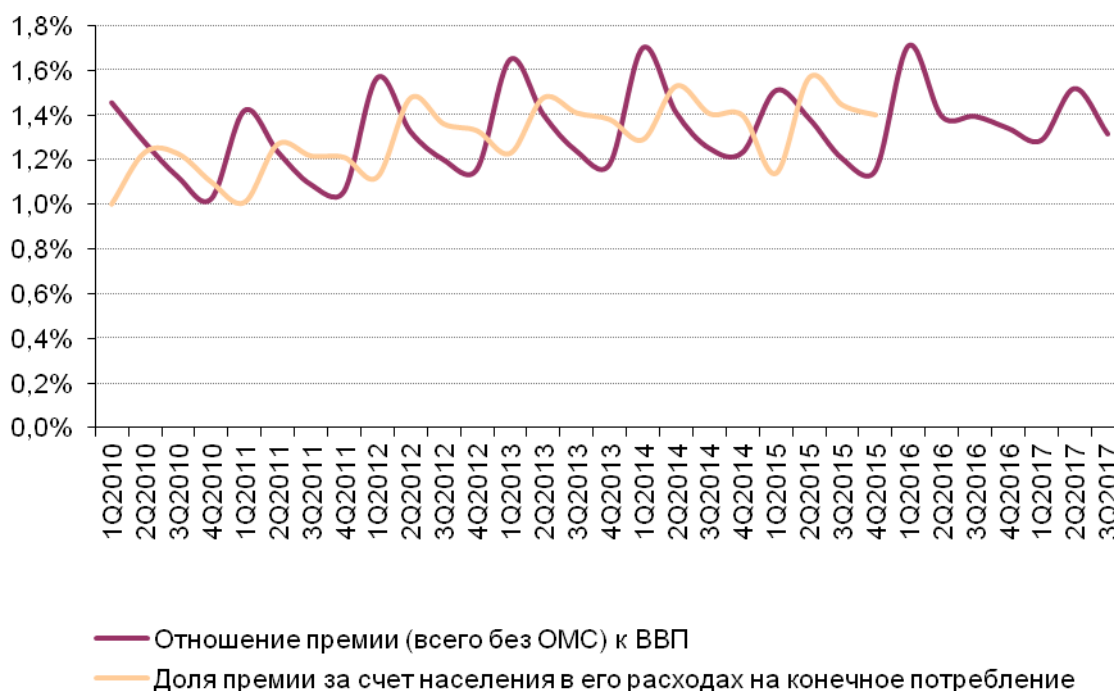
Рис. 2. Отношение премии на рынке всего без ОМС к ВВП в 1Q2010 – 3Q2017 гг.