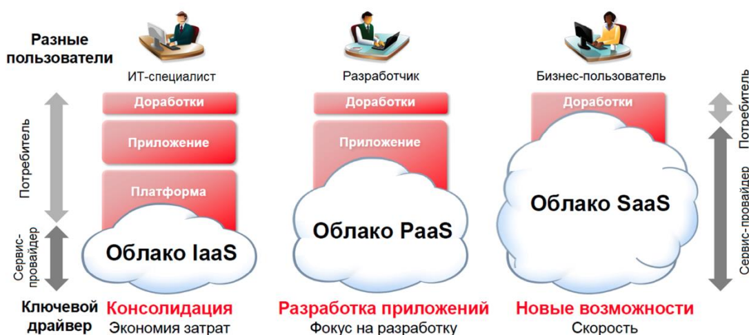
Рисунок 1. Облачные решения по модели обслуживания

На рисунке 1 представлены три основных формата облачных решений по модели обслуживания.