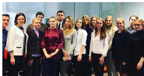
Студенты ФМЭО на тренинге в Компании Thomson Reuters, 2018 г.