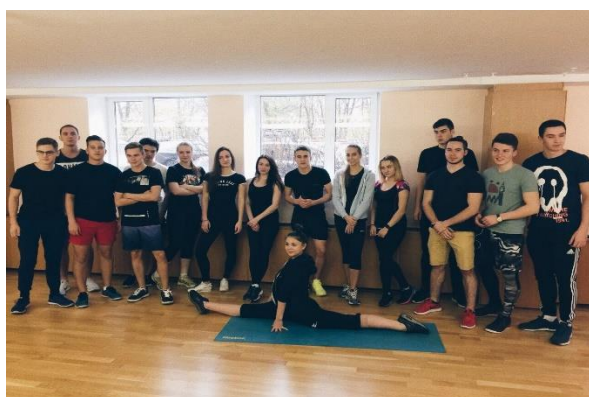
Студенты ФМЭО – участники оздоровительного проекта Финуниверситета - «Кубок Ректора по комплексу ГТО», 2018 г.

Воспитательная работа на Факультете направлена на создание условий для раскрытия способностей и самореализации личности студента, что способствует эффективной социализации и адаптации в современном обществе. Стратегической целью воспитательной работы на Факультете является обеспечение оптимальных условий для становления и саморазвития личности студента, будущего специалиста, обладающего мировоззренческим потенциалом, высокой культурой и гражданской ответственностью, способного к профессиональному, интеллектуальному и социальному творчеству. Регулярными мероприятиями на Факультете являются: серии ознакомительных экскурсий для студентов в организации – партнеры факультета; участие в образовательных тренингах «Школа актива»; в культурно-массовых и спортивных мероприятиях Финуниверситета - в кроссе первокурсника, в первенстве по футболу, баскетболу, бадминтону, плаванию и других спортивных мероприятиях.