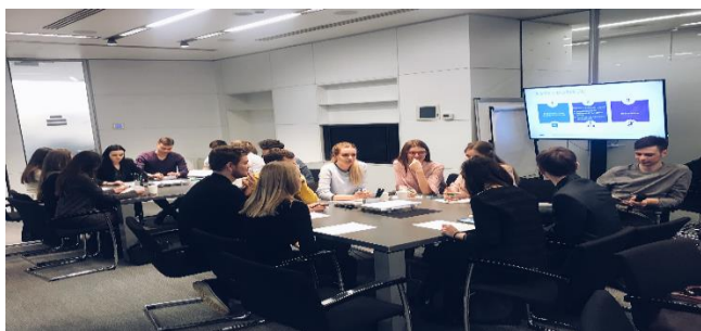
Студенты ФМЭО на тренинге в КПМГ, 2018

Кроме того, сформирована команда волонтеров Факультета международных экономических отношений. Совместно со Студенческим советом и Научным студенческим обществом факультета организуются встречи и мастер-классы с работодателями, такими как ПАО Московская биржа, PWC, KPMG, SCANIA, ПАО «Интер РАО».