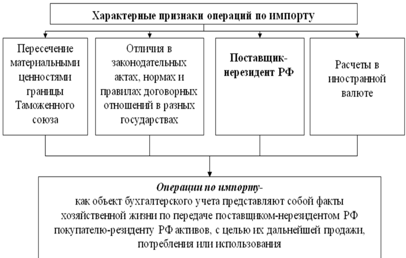
Рис.1 Характерные признаки операций по импорту

Исследование трудов отечественных авторов и нормативных документов, регулирующих ВЭД, позволило сделать вывод, что категория «импорт» трактуется неоднозначно. При выявлении сущности категории «импорт» был проведен сравнительный анализ определений. Современные импортные операции очень разнообразны, это не представляет возможности предложить один признак, в соответствии с которым можно однозначно идентифицировать операцию как импортную. Выделенные характерные признаки операций по импорту представлены на рисунке 1.