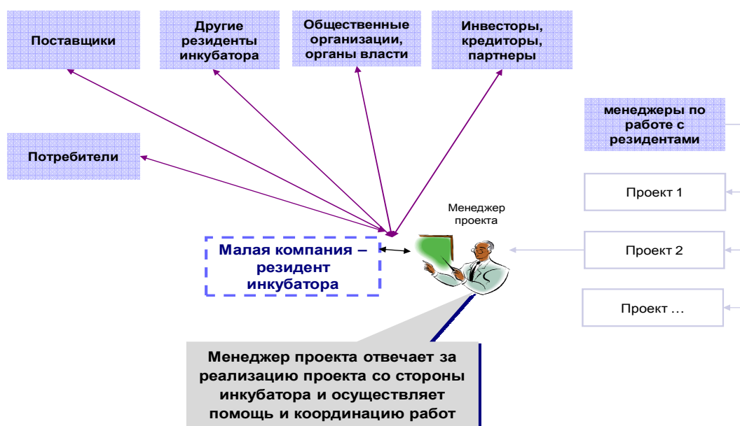
Рисунок 2 - Схема управления проектами в бизнес-инкубаторе

Схема управления проектами в бизнес-инкубаторе представлена на рисунке 2.