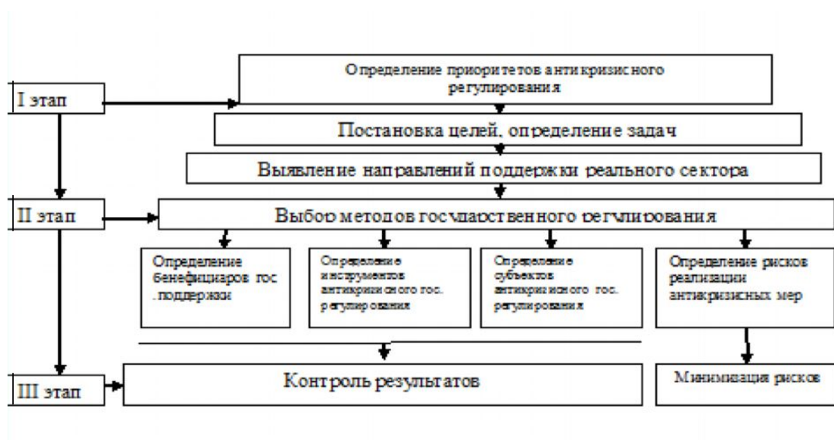
Рисунок 1.- Этапы антикризисного государственного регулирования реального сектора экономики

В диссертации подчеркивается, что принципиальное значение для эффективного антикризисного регулирования реального сектора имеет своевременное определение и минимизация рисков.