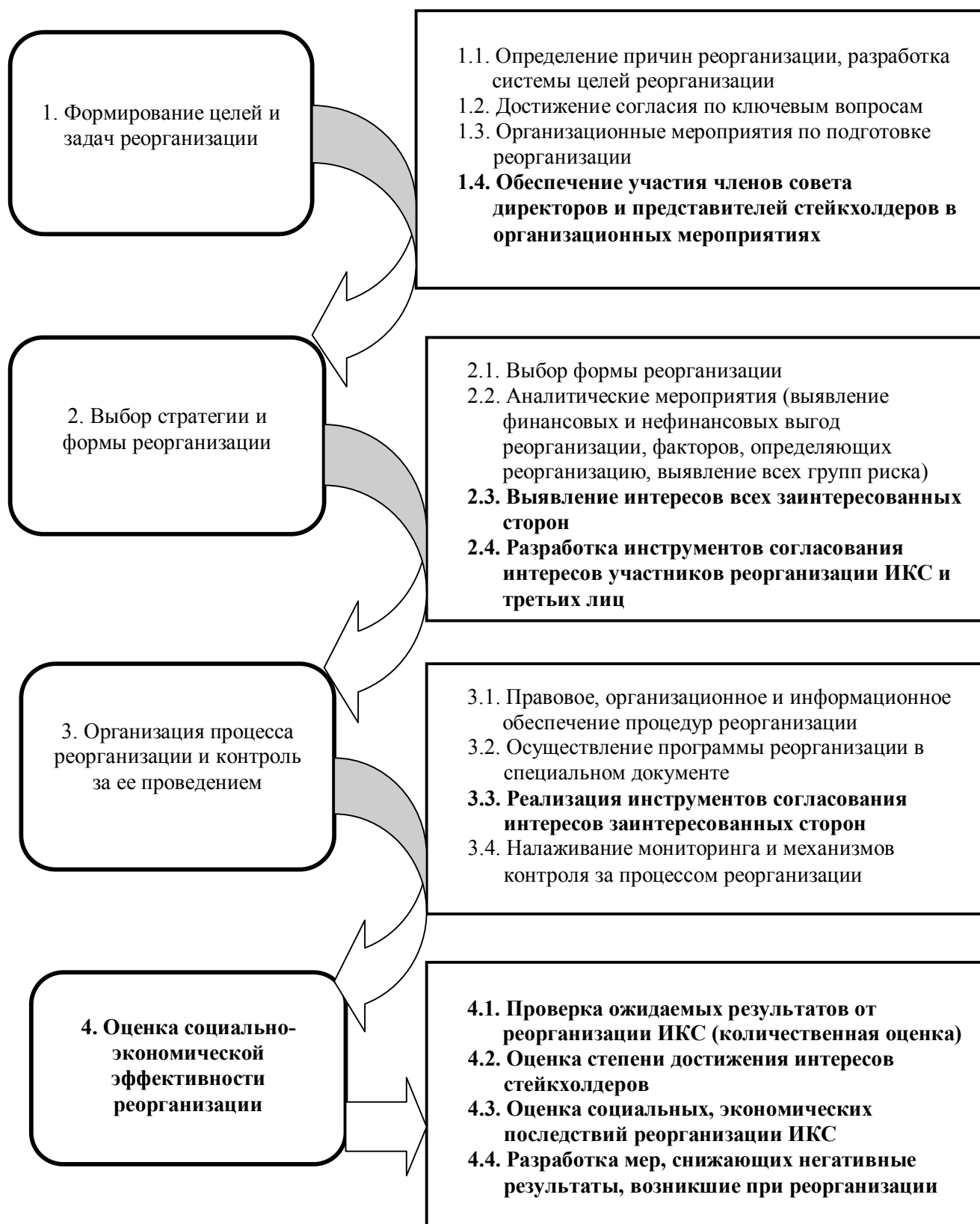
Рисунок 4. Алгоритм оценки эффективности реорганизации ИКС

Важным этапом процедуры оценки результатов реорганизации ИКС должна стать оценка социально-экономической эффективности реорганизации ИКС,