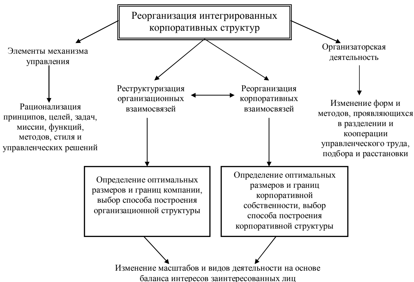
Рисунок 1. Основные направления реорганизации ИКС

закрепление конкретных видов деятельности; изменение масштабов и видов деятельности на основе слияния, поглощения, разделения по видам бизнеса и т.п. В организации управленческого труда содержание реорганизации определяется эффективностью осуществления специфических форм и методов организаторской деятельности, к которым относятся: разделение и кооперация управленческого труда; формирование норм и нормативов управляемости, численности; организационное проектирование на основе регламентации; организация рабочих мест; подбор и расстановка кадров и т.п. И, наконец, в последнем случае речь идет о выборе эффективных методов корпоративного управления в ходе изменения масштабов и видов деятельности ИКС, создающих надлежащие условия для их дальнейшего развития и обеспечивающих баланс интересов всех заинтересованных сторон (рисунок 1).