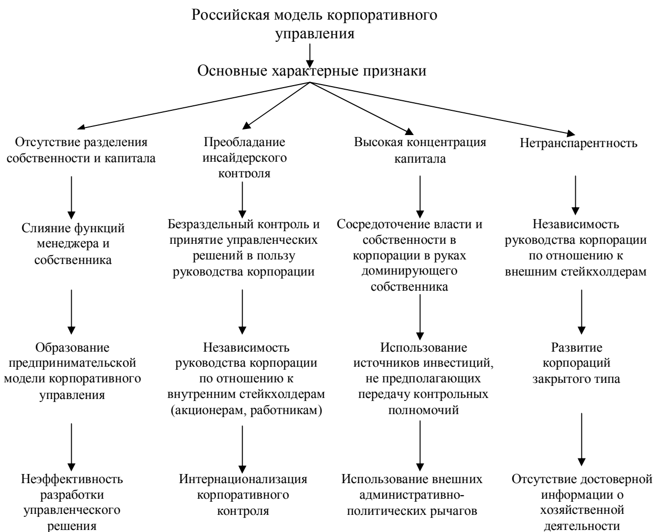
Рисунок 2. Основные характерные признаки российской модели корпоративного управления

В диссертации показано, что постановка задачи проведения реформирования системы корпоративного управления, как органической составной части реорганизации корпорации, следует считать новой и весьма перспективной. В российских ИКС становится очевидным, что существенные недостатки применяемых моделей корпоративного управления препятствуют эффективному проведению реорганизации компаний в целом. В частности, отсутствие или дефицит реальной возможности у акционеров (и не только миноритарных) осуществлять права, связанные с участием в управлении акционерным обществом, формальное участие советов директоров в стратегическом управлении, отсутствие эффективного контроля деятельности исполнительных органов акционерного общества (наряду с отсутствием должной подотчетности совета директоров акционерам),