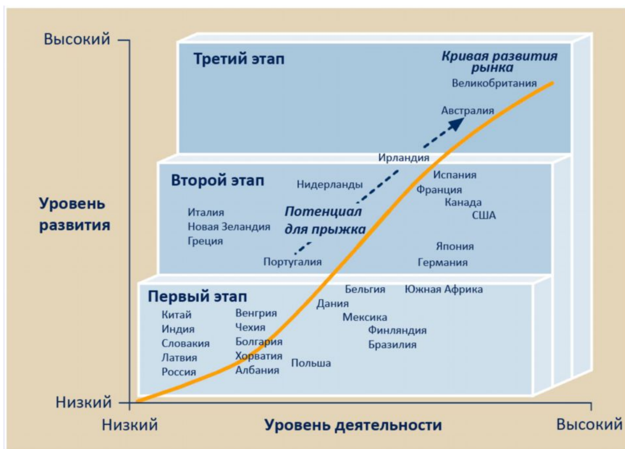
Рис. 2. Кривая развития рынка государственно-частного партнерства

В исследовании показано, что ГЧП с различным успехом развивается во многих странах мира. Наибольшего распространения эта концепция достигает в странах с развитой рыночной экономикой и с устоявшимися традициями взаимодействия государства и частного секторов (рисунок 2).