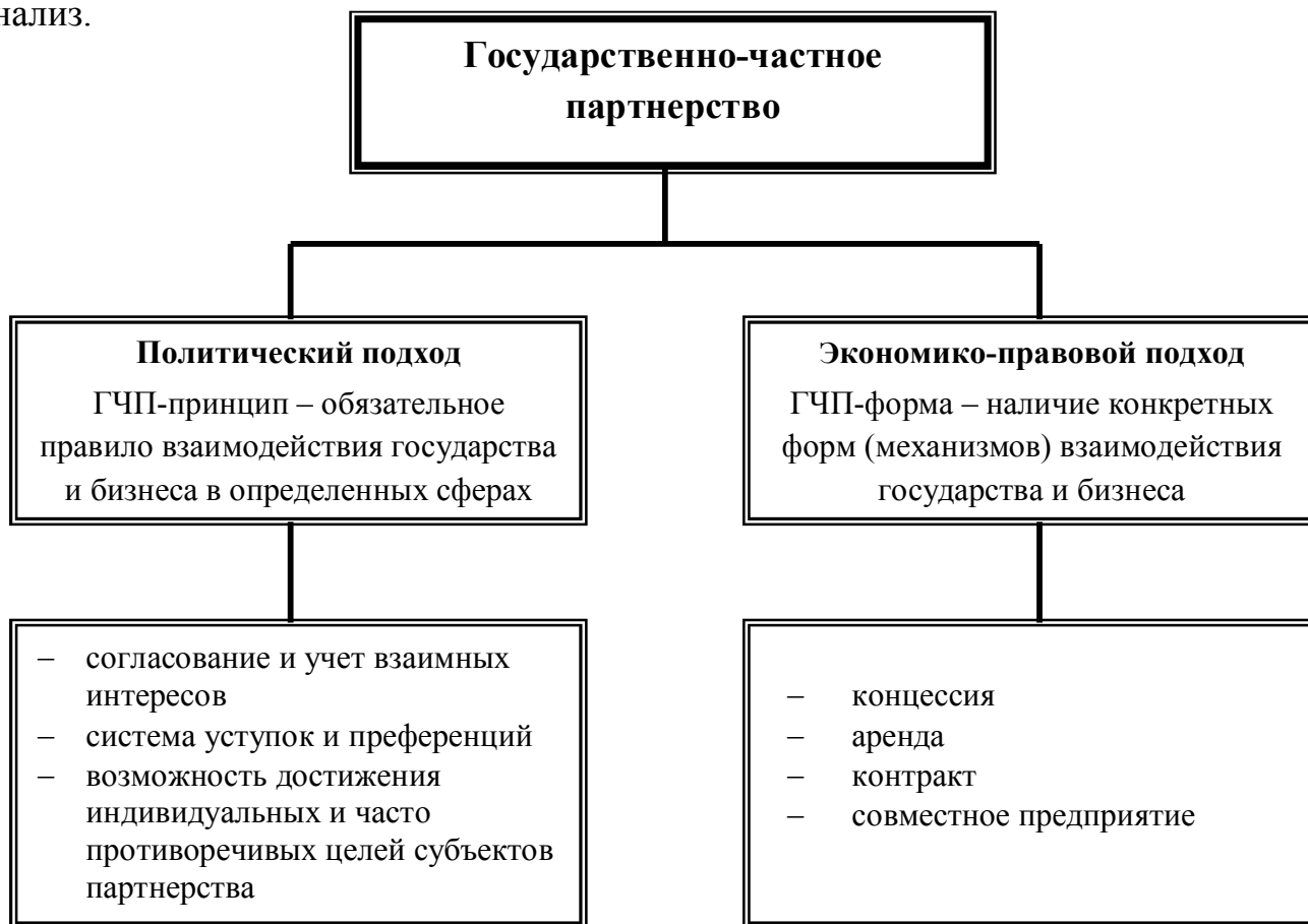
Рис. 1. Общая трактовка термина «государственно-частное партнерство» в России

В исследовании показано, что в России ГЧП является сравнительно новым инструментом объединения усилий государства и бизнеса. На рисунке 1 представлены две основные трактовки термина ГЧП применяемых в России: политический и экономико-правовой, которые позволил выделить проведенный анализ.