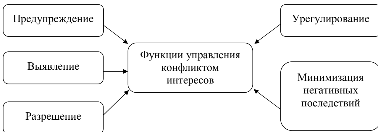
Рисунок 2 – Функции управления конфликтом интересов

Процедуры и инструменты механизма управления конфликтом интересов разделены по функциям (рисунок 2).