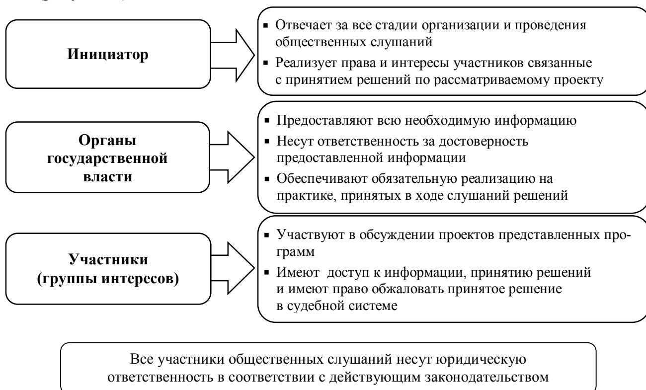
Рисунок 3 – Права и обязанности участников общественных слушаний

Разработан перечень прав и обязанностей участников общественных слушаний (рисунок 3).