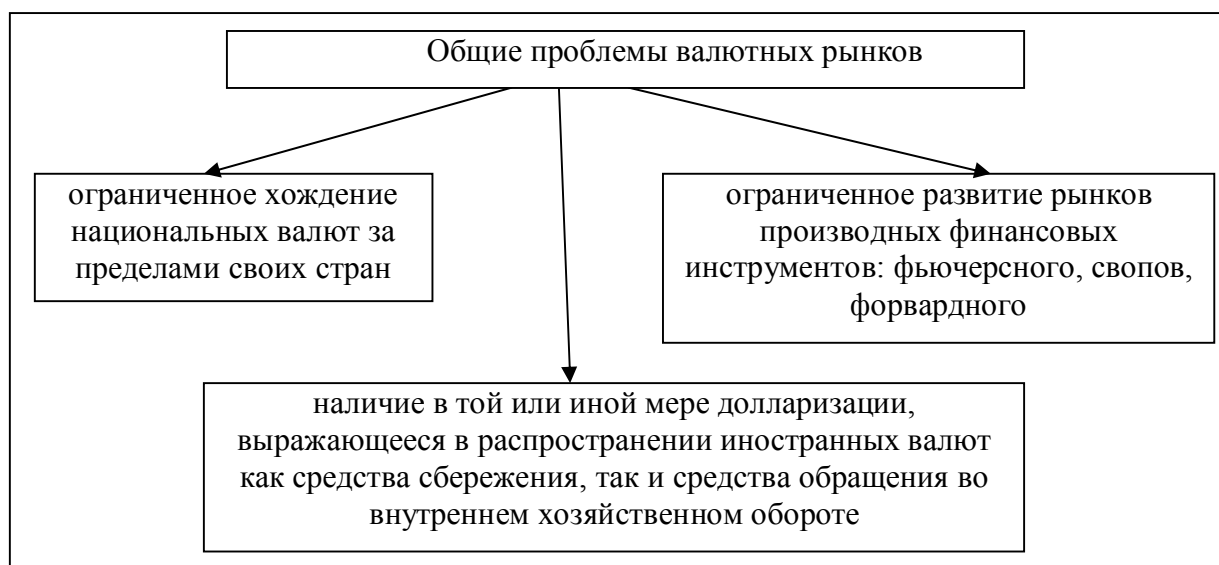
Рисунок 3. Общие проблемы валютных рынков.

Существующие в настоящее время общие проблемы валютных рынков, представленные на рис. 3, тормозят и негативно влияют на интеграционные процессы стран ЕврАзЭС.