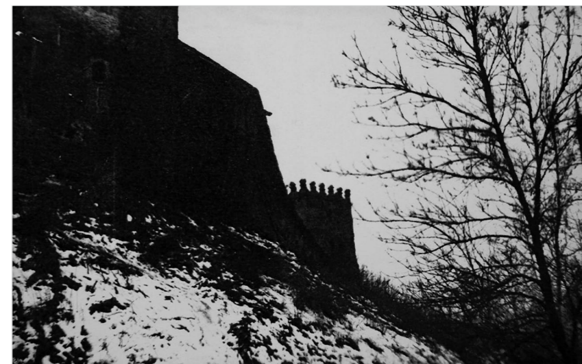
Монастырь в Луцке, в годы войны ставший тюрьмой

вященных нашей выпускнице. В частности, провести встречу студентов, работников музея и пресс-службы СВР и издать материалы, оборудовать в