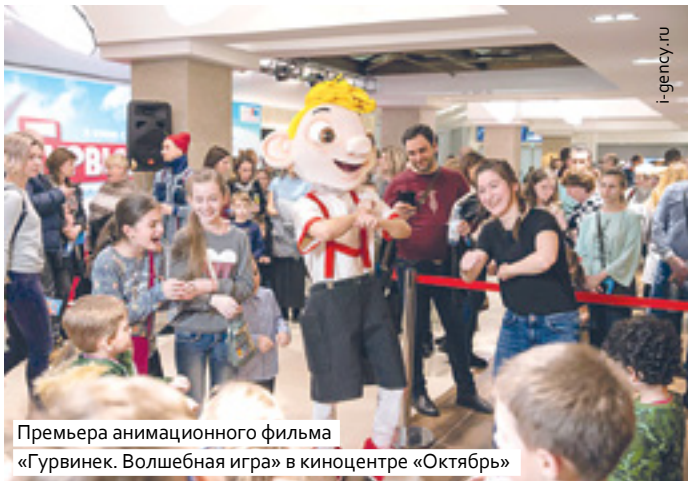
Премьера анимационного фильма «Гурвинек. Волшебная игра» в киноцентре «Октябрь»