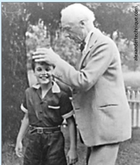
Правильная осанка – залог здоровья. Воздействия позвоночника при неправильном его расположении на внутренние органы могут вызывать всевозможные болезни. Ф.М. Александер разработал методику, позволяющую вовремя заметить нарушения, а также исправлять уже существующие проблемы посредством наблюдения и осознания собственного тела. Главная и первоочередная задача человека – понять, что осанка влияет на здоровье в значительной степени.