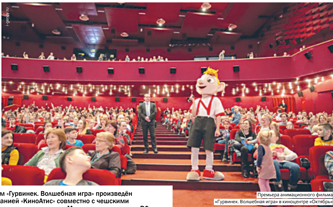
Премьера анимационного фильма «Гурвинек. Волшебная игра» в киноцентре «Октябрь»

Чешско-российско-бельгийский мультфильм «Гурвинек. Волшебная игра» отказались показывать 90% кинотеатров России. Причиной стал конфликт из-за мультфильма «Королевский корги», выход которого на экраны был запланирован на тот же день.