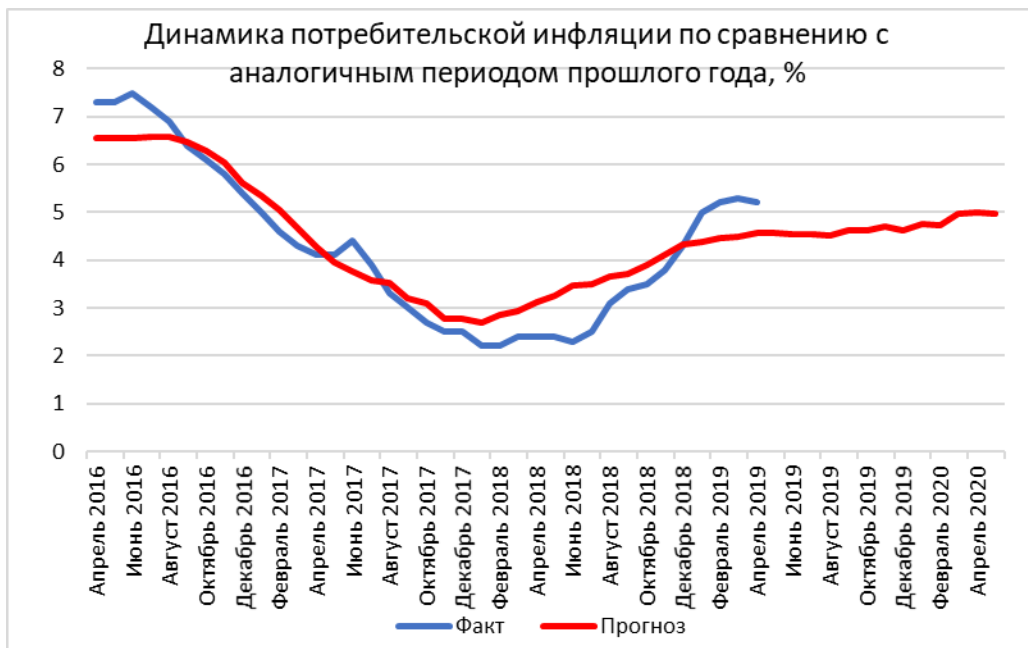
Рисунок 2. Динамика Индекса потребительских цен в России – фактические и прогнозные значения