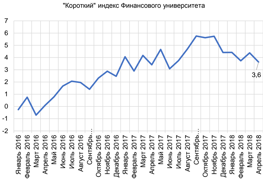
Рисунок 1. «Короткий» индекс Финансового университета при Правительстве РФ в 2016-2018 годах