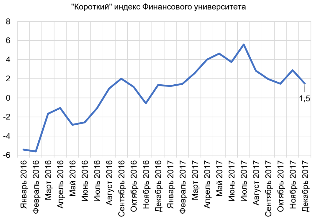
Рисунок 1. «Короткий» индекс Финансового университета при Правительстве РФ в 2016-2017 годах