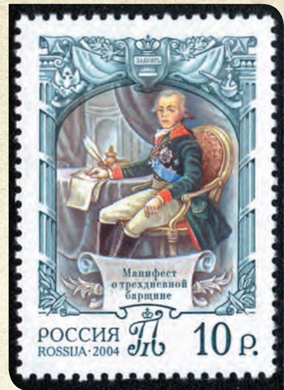
Российская почтовая марка «Павел I подписывает Манифест о трёхдневной барщине», выпущенная к 250-летию со дня рождения императора в 2004 г.

Судьба манифеста о трехдневной барщине при Александре I определилась тем, что престол, фактически, смирился с бойкотированием его норм дворянско-помещичьими кругами. От-