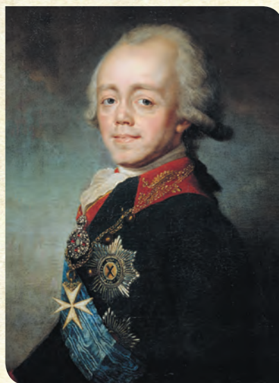
Павел Петрович, Император и Самодержец Всероссийский, Великий магистр Мальтийского ордена, Граф Ольденбургский, Герцог Шлезвиг-Гольштейн-Готторпский, президент Адмиралтейств-коллегии (портрет художника С.С.Щукина)

Среди других категорий крестьян наиболее многочисленными были государ-