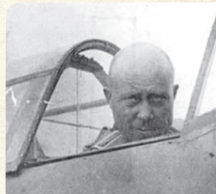
Курская дуга, 1943 г. Перед очередным боевым вылетом

Личный состав 171-го Тульского истребительного полка знал, что в сложной обстановке эскадрильи в бой поведет командир полка под-