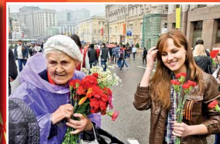
Праздник 67-летия Великой Победы студенты Финансового университета по традиции встретили в самом сердце столицы. Прошли пешком через центр Москвы и с нетерпением дожидались окончания праздничного парада, чтобы поздравить ветеранов. Под звуки песен и маршей военных лет мы пришли сказать им «Спасибо!» за Победу, за новую весну, за жизнь, в которой нет войны.