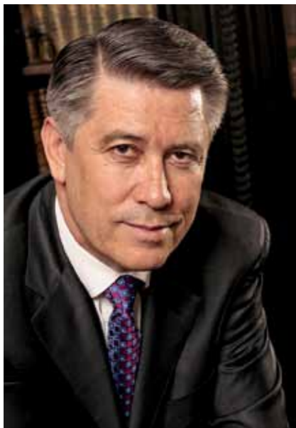
Михаил Абдурахманович Эскиндаров Ректор Финансового университета при Правительстве Российской Федерации, профессор.

2 мая 2012 года было подписано распоряжение Правительства Российской Федерации о реорганизации в форме присоединения к Финансовому университету при Правительстве Российской Федерации двух вузов: Государственного университета Министерства финансов Российской Федерации и Всероссийской государственной налоговой академии Министерства финансов Российской Федерации. Вполне естественно, что в связи с этим распоряжением у студентов, преподавателей и сотрудников как присоединяемых, так и нашего вуза, возникло много вопросов. На них отвечает ректор Финансового университета при Правительстве Российской Федерации Михаил Абдурахманович Эскиндаров.