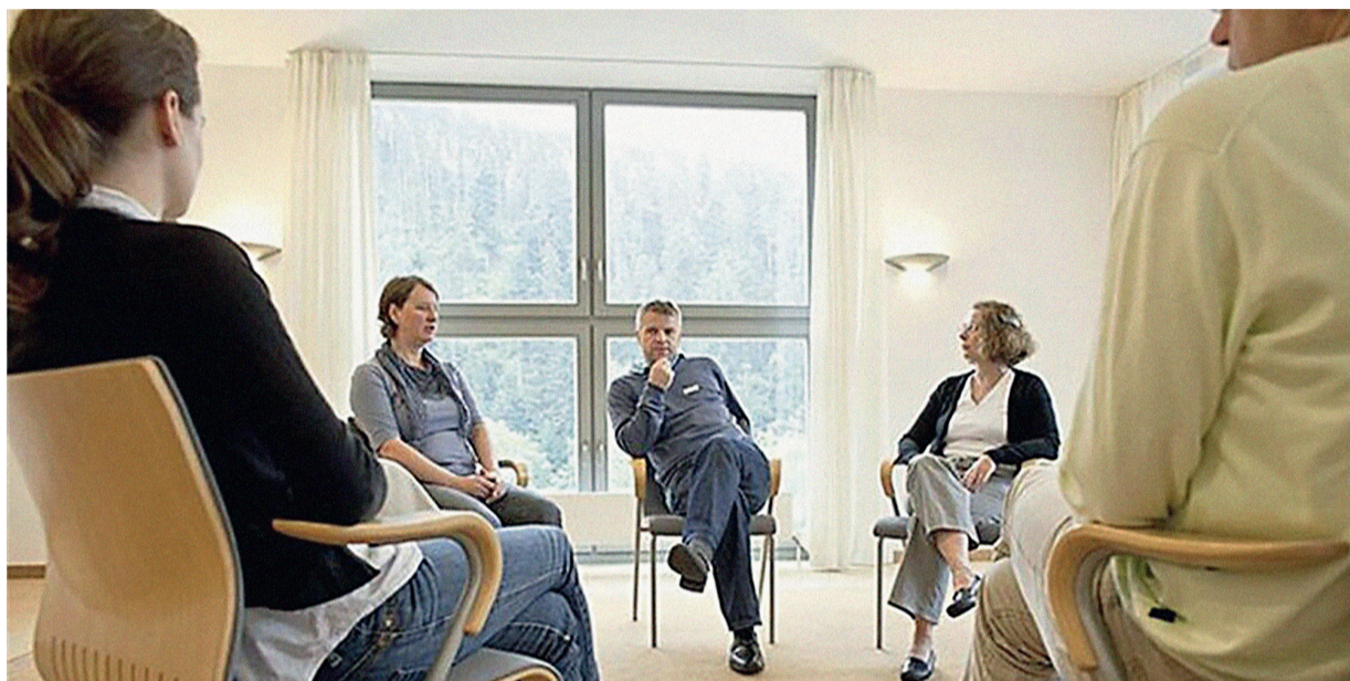
Психологическая поддержка сейчас возможна только при соблюдении дистанции. family-rehab.com

Рынок психологических услуг перебрался в онлайн