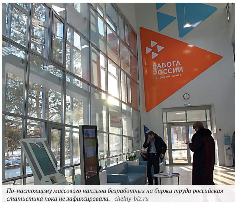
По-настоящему массового наплыва безработных на биржи труда российская статистика пока не зафиксировала.

Но важнее, по мнению президента, правительству и Федеральному собранию реализовать еще