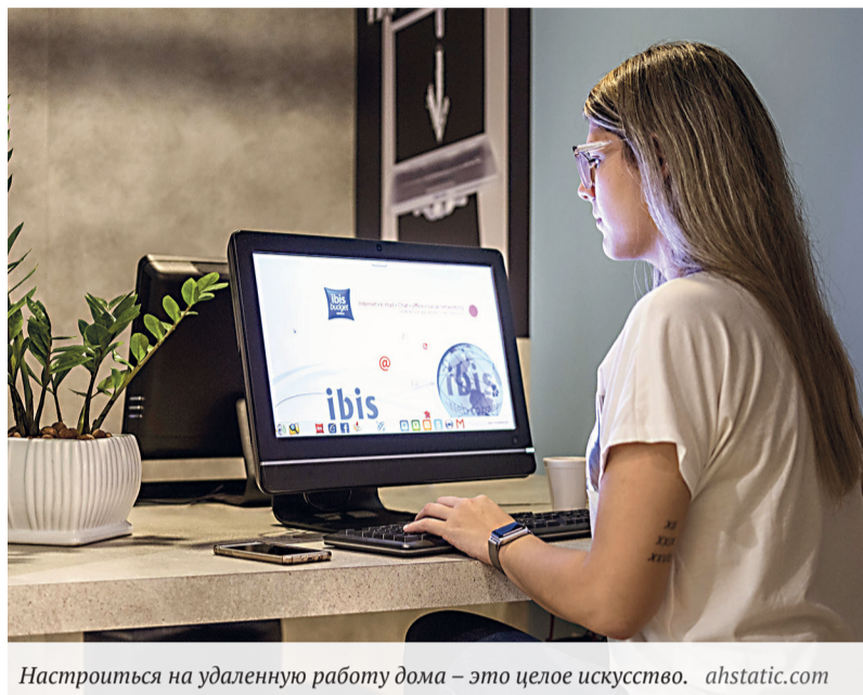
Настроиться на удаленную работу дома – это целое искусство.

Переход на удаленную занятость, как уже говорилось, должен сопровождаться мерами поддержки и повышения квалификации персонала. Но не меньше всего вышперечисленного важна помощь работникам в приобретении самого навыка «удаленная работа»,