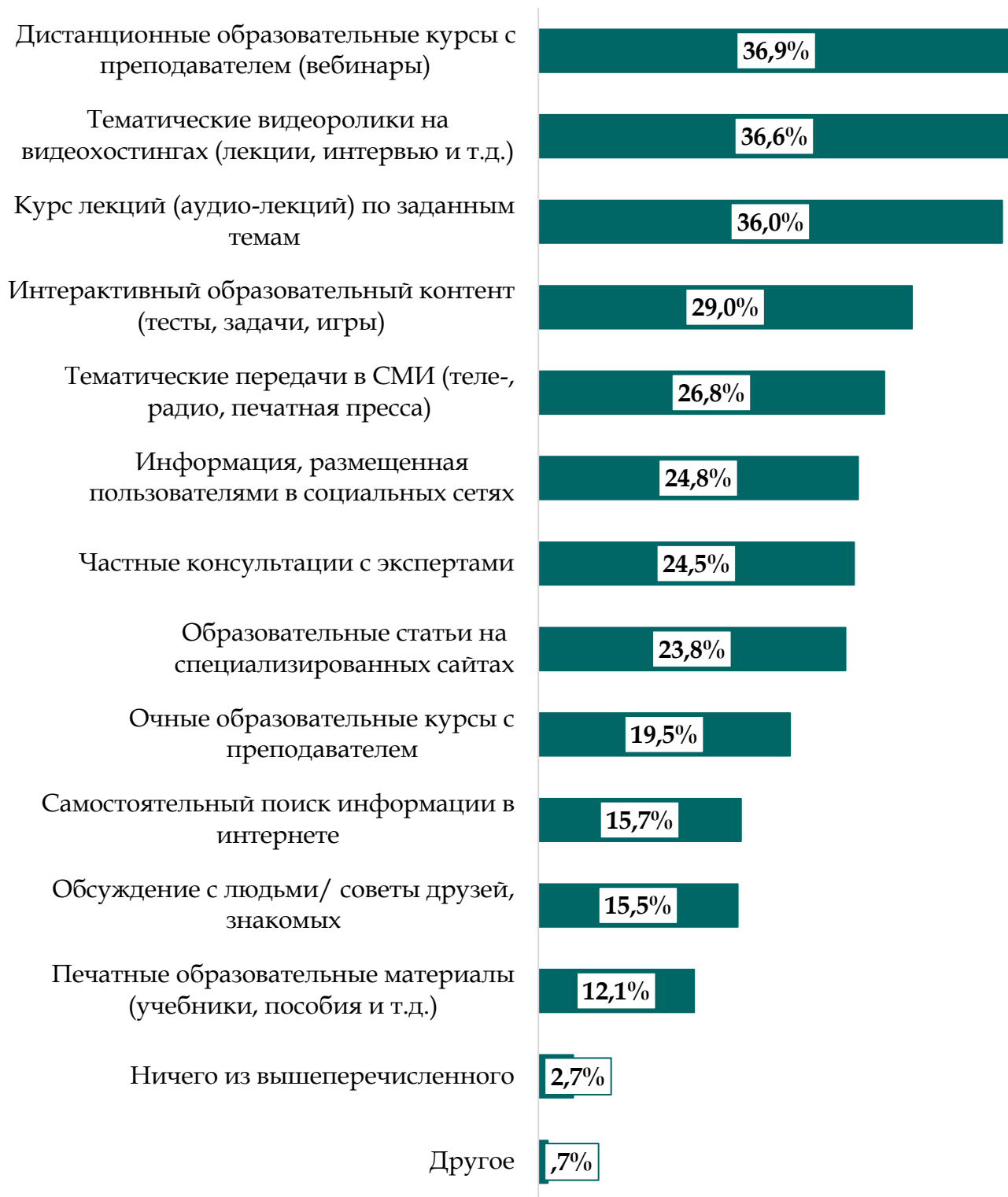
Рисунок 2. Каналы, с помощью которых граждане хотели бы повысить свою финансовую грамотность