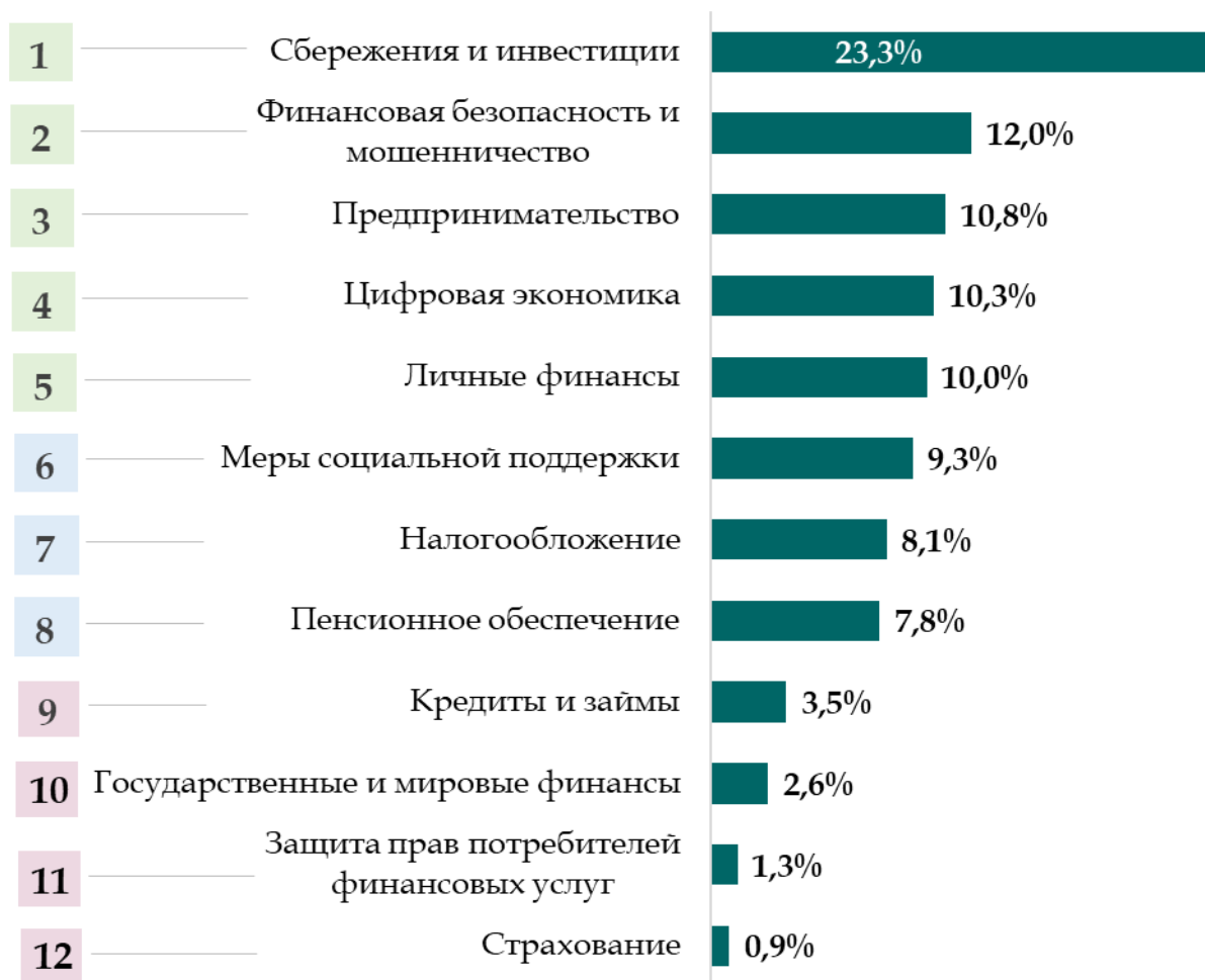
Рисунок 1. Темы финансовой грамотности, по которым россияне испытывают потребность в повышении уровня знаний и навыков в первую очередь