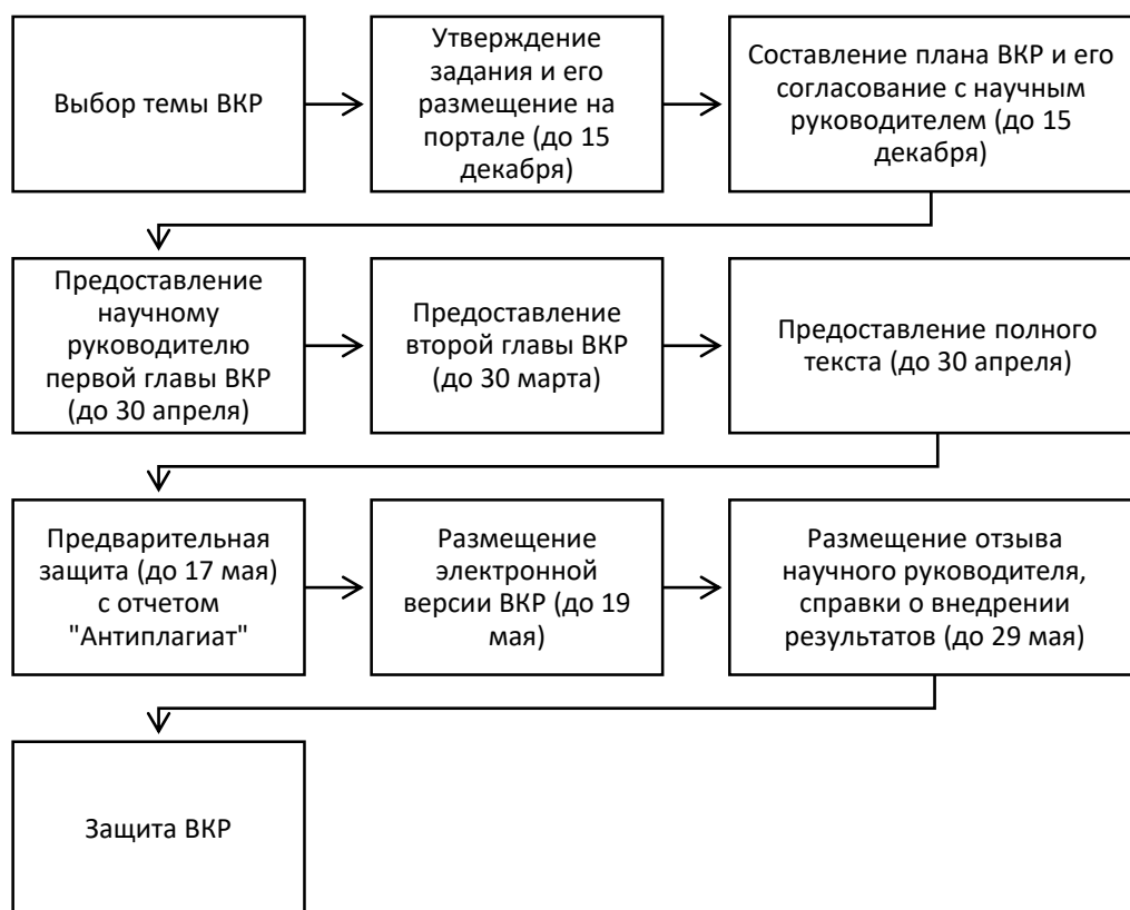
Рисунок 1 – График подготовки выпускных квалификационных работ

6. Сдача готовой ВКР в Департамент бизнес-информатики.