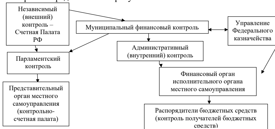
Рисунок 1. Система муниципального финансового контроля

Система муниципального финансового контроля должна соответствовать требованиям действующего законодательства и государственной финансовой политике. Система муниципального финансового контроля построена на основе трех видов – парламентского, независимого (внешнего), административного (внутреннего) финансового контроля и представлена на рисунке 1.