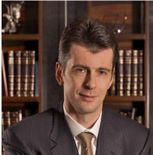
Прохоров Михаил Дмитриевич Российский политик и предприниматель