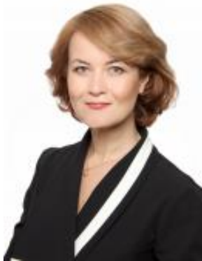
Игтисамова Лира Закуановна Министр финансов Республики Башкортостан