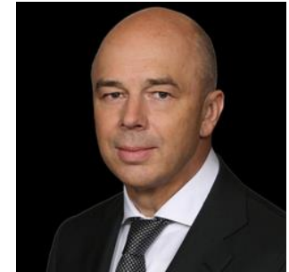
Антон Германович Силуанов Министр финансов Российской Федерации