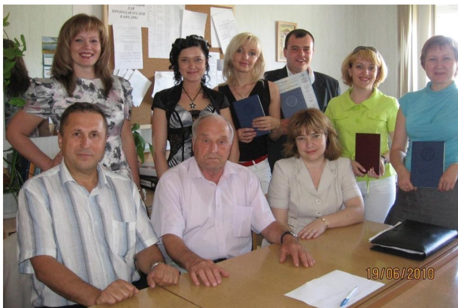
Вручение дипломов на кафедре, 2010 г.

Качество подготовки студентов обеспечивается научно-педагогическими кадрами, имеющими базовое образование и ученую степень, соответствующие профилю преподаваемых дисциплин и систематически занимающимися научной и научно-методической деятельностью. Преподавание по дисциплинам модуля общепрофессиональных и профессиональных дисциплин на кафедре осуществляют 6 штатных преподавателей, из них: 3 кандидата наук и 1 доктор экономических наук; 3 внутренних совместителя: из них 2 кандидата наук; 2 внешних совместителя: из них 1 кандидат наук и 1 доктор экономических наук.