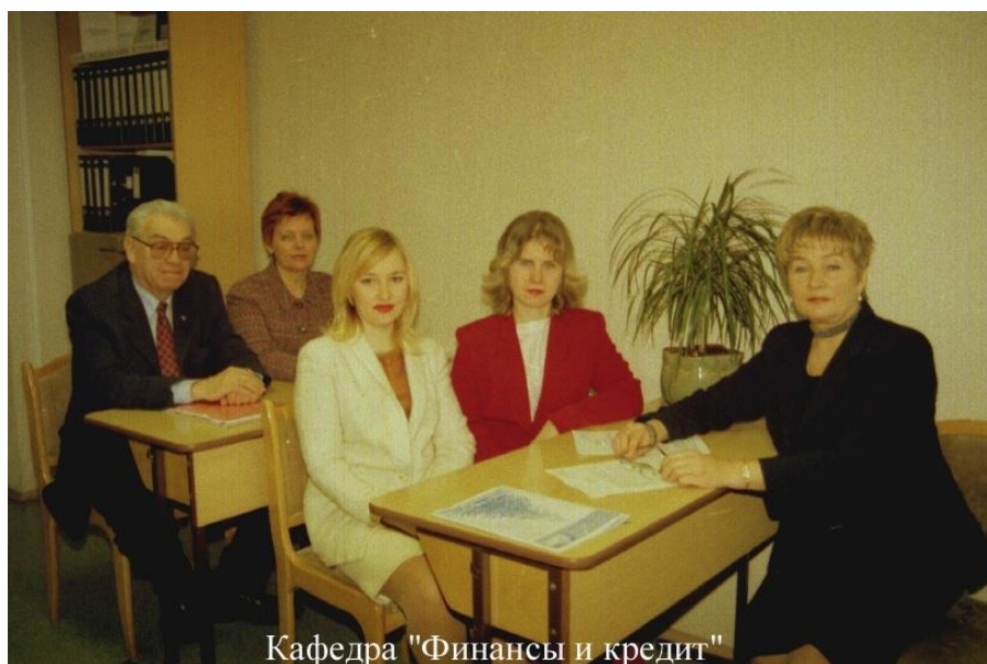
Кафедра "Финансы и кредит"

Вначале, для обеспечения учебного процесса, преподавания профилирующих дисциплин по специальности «Финансы и кредит» привлекались специалисты Московского отделения ВЗФЭИ, но развитие системы образования, повышение требований к качественному обеспечению учебного процесса, организации самостоятельной работы студентов потребовали создания самостоятельных подразделений филиала, ответственных за выпуск грамотных и высококвалифицированных специалистов. Это привело к созданию в 2001 г. в филиале ВЗФЭИ в г.Туле региональной кафедры «Финансы и кредит».