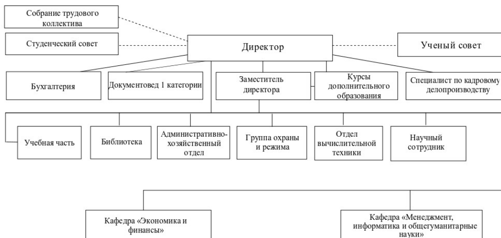
Рисунок 1. Структура Пензенского филиала Финуниверситета.

Общее коллегиальное руководство Филиалом осуществляет выборный представительный орган – Ученый совет Филиала. Полномочия Ученого совета Филиала, порядок его формирования определяются Положением об Ученом совете Филиала, утвержденным Ученым советом Финуниверситета.