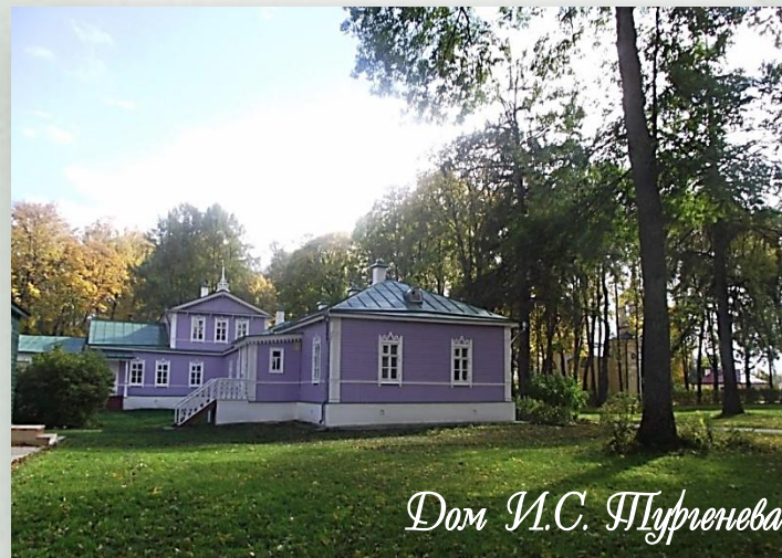
Дом И.С. Шуренева