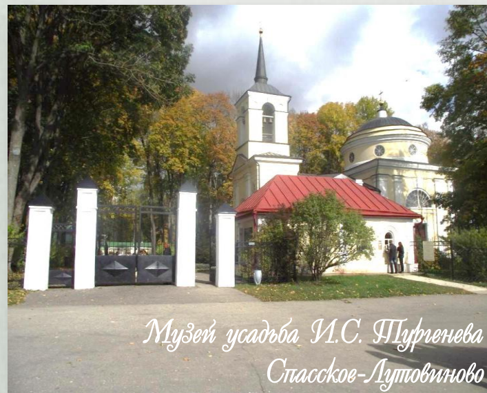
Музей усадьба И.С. Шуренева Спасское-Лутовкино