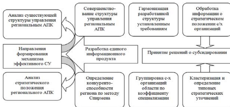
Рис. 2. Алгоритм формирования механизма эффективного стратегического управления региональным АПК.

ских связей. При этом, совершенно очевидно, что основным этапом в алгоритме формирования механизма эффективного стратегического управления является совершенствование существующей системы управления региональным АПК, так как именно органы власти способны, и должны стать, аккумулятором, поддерживающим постоянную обратную связь через сбор стратегической информации о состоянии сельскохозяйственных организаций региона, «доставке» полученных сведений на федеральный уровень. Кроме того, такие данные о стратегических группах, саккумулированные на высшем уровне, могут стать основой для принятий решений о разработке национальных программ и проектов под конкретный регион.