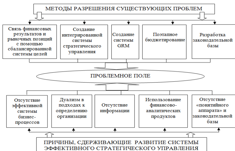
Рис. 1. Причины, сдерживающие формирование системы эффективного стратегического управления, и методы их разрешения.

мер, направленных на качественное изменение объекта управления на перспективу, посредством эффективного использования современных аналитических систем [5].